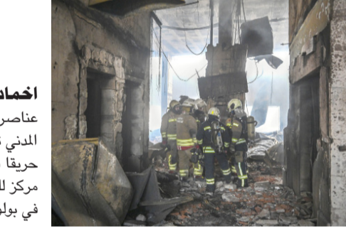
إخماد عناصر الدفاع المدني تخمد حريقاً في مركز للتزلج في بولو

أسفر حريق هائل اندلع في مركز للتزلج في بولو، شمالي البلاد، في مقتل 66 شخصاً وإصابة العشرات، واندلع الحريق في قسم المطاعم داخل الفندق المكون من 12 طابقاً، ثم انتشر بسرعة فائقة، وتسبب البناء المتحشي لفندق كارنال كايا، أحد منتجعات التزلج الكبرى في تركيا، في سرعة اجتياح النيران للمبنى بأكمله. ويقع الفندق على ارتفاع 2200 متر، وكان يشغله وقت الحريق 237 نزلياً، بمعدل إشغال بلغ نحو 80 إلى 90 بالمئة، بسبب العطلة الفصليّة. وأكد وزير الداخلية التركي علي برلي كايا في تصريح امس ان (حضيصة الضحايا بلغت 66 قتيلاً و51 مصاباً).