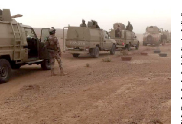
انتشار القوات الأمنية تنتشر في صحراء الأنبار

من ضبط 6 حاويات في نقطة البحث والتحري تحتوي أدوية ومستلزمات طبية مع درجات نارية، ممنوعة من الاستيراد. وقال بيان تلقته (الزمان) امس ان (المستلزمات الطبية تحتاج لموافقات الجهات القطاعية، وكذلك رسومها أكثر مما ذكر في المعاملات الكمركية، حيث ان جميع المواد المضبوطة لم يتم التصريح عنها في المعاملة الكمركية المنجزة بهدف التهريب)، مؤكداً انه (تم إحالة الحاويات والعجلات والمواد المضبوطة إلى الجهات القضائية لاتخاذ الإجراءات القانونية اللازمة ومحاسبة المقصرين).