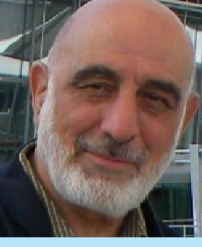
زهر غام الديباغ