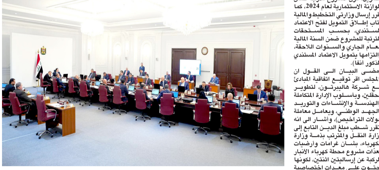
جلسة جانب من الجلسة الاعتيادية لمجلس الوزراء

ملحوظاتها بشأن التقرير النصف سنوي الرابع لتأدية تنفيذ البرنامج الحكومي، كل حسب تخصصه، على أن تتولى سكرتارية فريق متابعة تنفيذ البرنامج إجراء التعديلات اللازمة على وفق الأصول، ورفع التقرير موضح البحث بصيغته النهائية إلى رئيس مجلس الوزراء لإقراره ورفع على مجلس النواب، وأوضح البيان ان (الجلسة شهدت تقييم الأداء للمسؤولين والمديرين العامين، وفق الأسس التي سبق إقرارها، وتم التصويت على تثبيت 14 مديرا عاما بعد التقييم، في مختلف دوائر الدولة)، مبينا ان (المجلس وافق على تصديق إتفاقية مكة المكرمة للدول الأعضاء في منظمة التعاون الإسلامي، للتعاون في مجال إنفاذ قوانين مكافحة الفساد الموقعة في دولة قطر وإحالتها إلى مجلس النواب)، مؤكدا (إقرار مبادئ التعاون بين وزارة الكهرباء وشركة ستيلار ابترجي، والمضي بتنفيذ بنود الإتفاقية، وتحويل وزارة الكهرباء الصلاحية اللازمة للتعاقد مع الشركة المذكورة، استفاء من اساليب التعاقد في تنفيذ العقود الحكومية، وبما يضمن سرعة الإنجاز وتحقيق الهدف المرجو، وأن يدخل العقد حيز النفاذ عند توفير التخصيصات المالية، ولفت إلى أنه (تقرر إدراج وزارتي المالية والتخطيط، مبادئ التعاون بشأن الطاقة ضمن تخصيصات موازنة العام الجاري، بمبلغ مليار دولار،