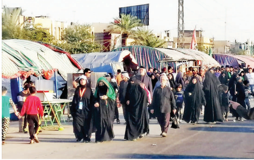
زوار: خشود الزائرين سيرا على الاقدام نحو الكاظمية المقدسة

ونوه الصافي الى تجهيز الشركة العامة للنقل الخاص بـ 25 الف مركبة توزعت بين المراتب الخدمية الزائرين القادمين والمغادرين من المحافظات، فيما تتشارك الشركة العامة لسكك الحديد بـ 11 قطارا قبلا للزيادة في ايام نزوة الزيارة، وفي محور محطة بغداد ساحة عدن وفرت ثلاثة قطارات، اما محروم الطبول ساحة عدن قطارين مع عربات سياحية، فضلا عن تسبير قطارات بغداد بصرة طيلة ايام الزيارة وبعدها. واوعزت الوزارة باهمية التنسيق التام وتطبيق خطة الوزارة، في تفويج الزائرين.