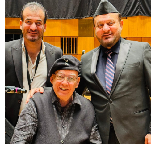
ليلة : لغظات من ليلة موسيقية غنائية عراقية في مالو.