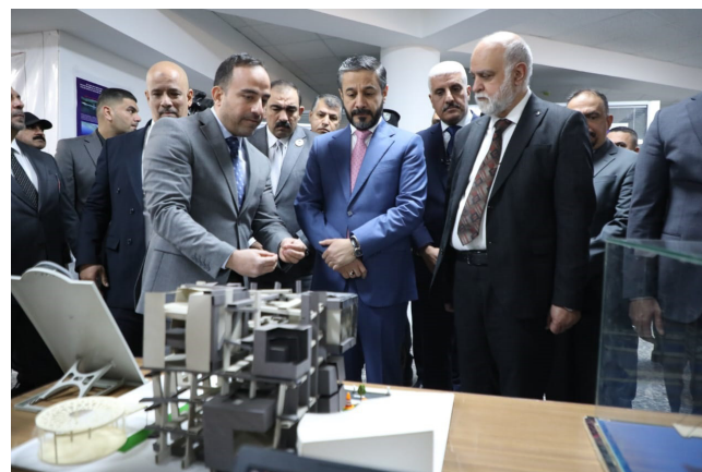
افتتاح وزير التعليم يفتح المعهد العالي للعلوم العدلية