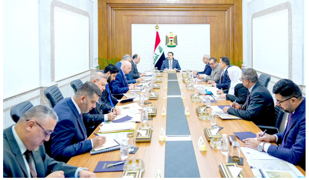
اجتماع: رئيس الوزراء محمد شياع السوداني خلال ترؤسه الاجتماع الدوري لمشروع مدينة الصدر