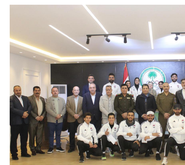
ابطال: اللجنة الاولمبية تحفني بمنتخب الكانوي أبطال العرب