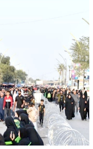
مواكب: زوار يسيرون بجانب المواكب الخدمية الخاصة بالزيارة الرجبية

بغداد والقوات الأمنية والجهات الساندة. كما ناقش الحضور تحديد خطوط سير النقل. بما يتناسب مع أعداد حشود الزائرين المتوقع في (الزيارة). من جانبه أوضح الحافظي، ان (الوزارة تعمل على تسكينها على اراضي مخصصة لتوزيع الزائرين من وإلى مدينة الكاظمية). لافتاً إلى (توزيع محاور النقل بمشاركة أكثر من 300 حافلة. إلى جانب تهيئة مفارز فنية مرافقة لصيانة الحافلات الطرية، فضلاً عن زيادة أعداد الحافلات وزجها للخدمة في (الزيارة). وأضاف ان (الشركة العامة للنقل الخاص اكملت استعداداتها بجهد 25 ألف مركبة. متوزعة في المرائب لخدمة الزائرين القادمين والمغادرين من المحافظات). مشيراً إلى (تخصيص الشركة العامة لسكك الحديد 11 قطاراً. والعدد قابل للزيادة في ذروة الزيارة).