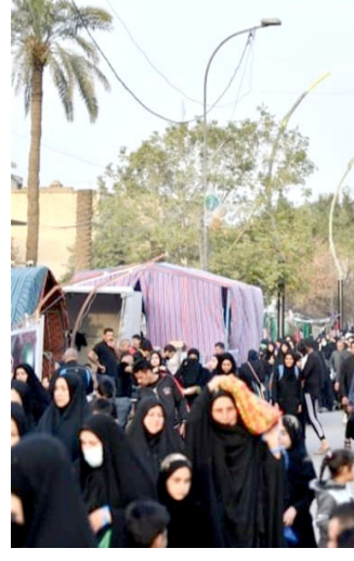
مواكب: زوار يسيرون بجانب المواكب الخدمية الخاصة بالزيارة الرجبية

بغداد والقوات الأمنية والجهات الساندة. كما ناقش الحضور تحديد خطوط سير النقل. بما يتناسب مع أعداد حشود الزائرين المتوقع في (الزيارة). من جانبه أوضح الحافظي، ان (الوزارة تعمل على تسكينها على اراضي مخصصة لتوزيع الزائرين من وإلى مدينة الكاظمية). لافتاً إلى (توزيع محاور النقل بمشاركة أكثر من 300 حافلة. إلى جانب تهيئة مفارز فنية مرافقة لصيانة الحافلات الطرية، فضلاً عن زيادة أعداد الحافلات وزجها للخدمة في (الزيارة). وأضاف ان (الشركة العامة للنقل الخاص اكملت استعداداتها بجهد 25 ألف مركبة. متوزعة في المرائب لخدمة الزائرين القادمين والمغادرين من المحافظات). مشيراً إلى (تخصيص الشركة العامة لسكك الحديد 11 قطاراً. والعدد قابل للزيادة في ذروة الزيارة).