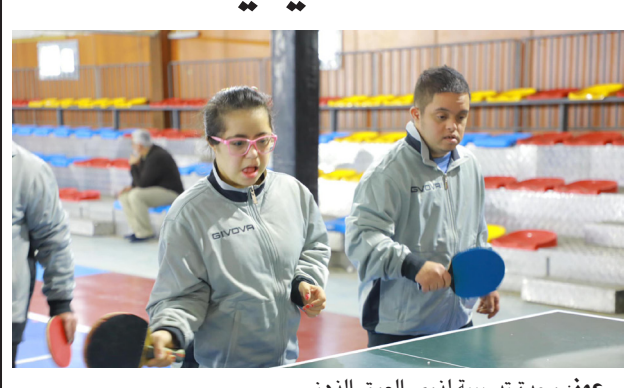
عوز: وحدة تدريبية لذوي العوق الذهني

بغداد- الزمان يواصل المركز الوطني لرعاية ذوي العوق الذهني وملازمة داو، في وزارة الشباب والرياضة، قسم الأششطة والبرامج، على ضرورة تكثيف مثل هذه الفعاليات الرياضية حتى يشعر الموظف بحالة من اليقظة البدنية والعمل الجماعي. وأضاف الوزير (أن كل وزارة ولا سيما وزارة الشباب والرياضة تحتاج إلى بيئة مصحوبة بالرياضة وكرة القدم التي تنمي روح العمل بين الموظفين، مقدماً شكره وتقديره للقاءمين على تنظيم البطولة والفرق المشاركة التي قدمت مستويات طيبة ولعبت بشكل جدي وحماسي).