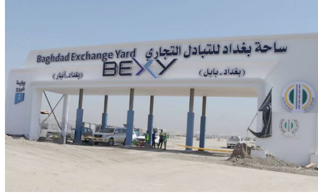
ساحة بغداد للتبادل التجاري BEXY (بغداد - بابل)