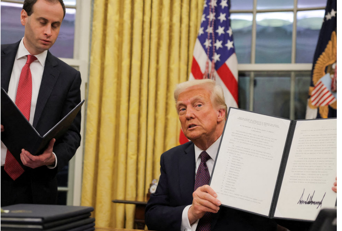
توقيع : الرئيس الأمريكي يوقع أحد الأوامر التنفيذية عقب تنصيبه رسمياً

(دعم العراق لإرساء الأمن والاستقرار في المنطقة والعالم، وتعزيز العلاقات الثنائية بين بلدينا الصديقين وبما يحقق المصالح المشتركة للشعبين). ويعدت رئيس الوزراء محمد شياع السوداني، برقية تهئة إلى ترامب، بمناسبة توليها مهام منصبه رئيساً للولايات المتحدة، وقال بيان تلقته (الزمن) أمس عن (برقية التهئة تضمنت تأكيد متمنين له النجاح والتوفيق في مهام عمله، مؤكداً