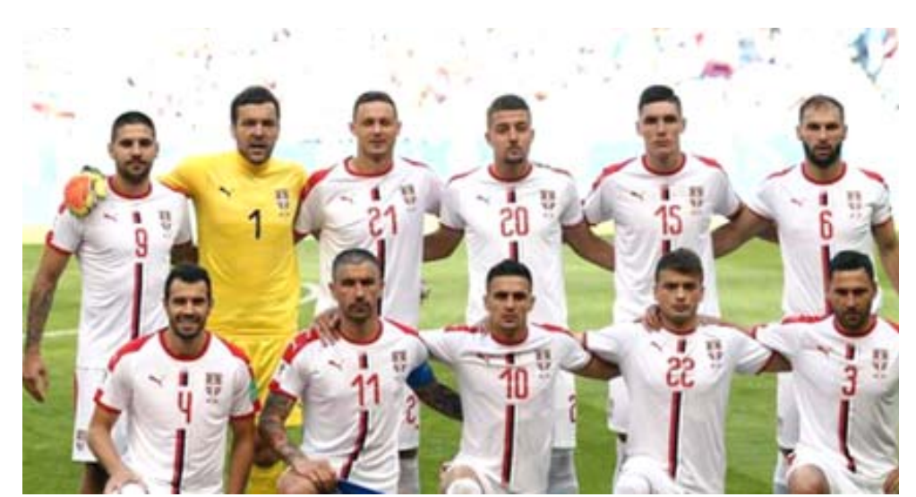
منتخب صربيا بكرة القدم