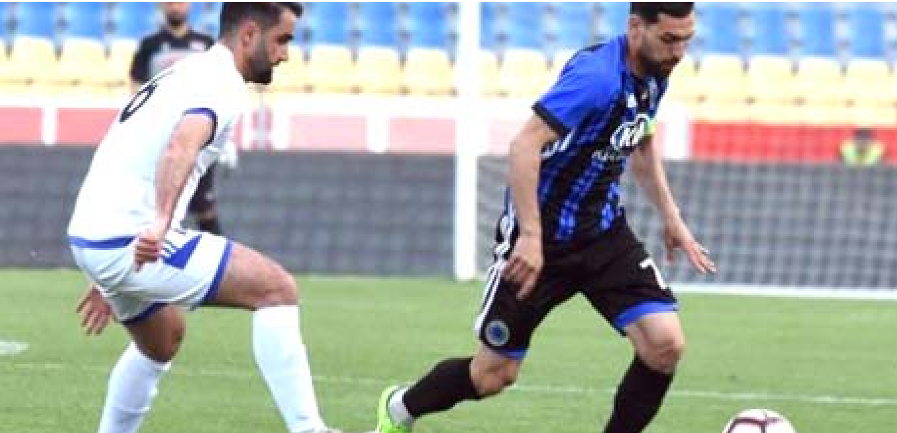
تعويض تسعى فرق الممتاز إلى التعويض في الجولة القادمة لما فقدته من نقاط

الناصرة - باسم الركابي الجنوب والمبني يتواجهان اليوم في لقاء الإخوة الأعداء مباريات الجولة 27 من مسابقة الدوري الممتاز بكرة القدم التي تظهر مهمة واستثنائية على الكتل في ضوء واقع المواجهات ومواقع الفرق نفسها وحالة التداخل وطموحات التعزيز ما يدفعها للعب بشعار الفوز لاغير وسط تصديقات المشاركة وأثارها التي عكستها على مجمل الأمور التي تظهر لإدراك الأمور المتزامنة تماماً بعيدة عن رغبة فرق وأكثر قسوة على أخرى وسط تأثير النقاط التي تعاني منها فرق الوسط والمؤخرة المسهدة على ترك مقاعدها إذا لن يفيق وتصحو.