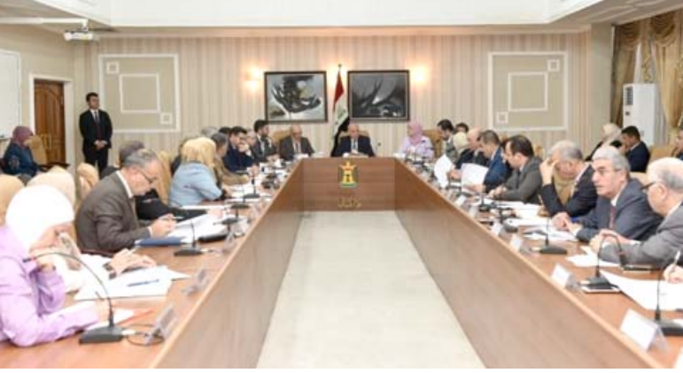
اجتماع : وزير المالية فؤاد حسين ترؤسه اجتماعاً لمناقشة استراتيجية الموازنة العامة

بغداد - الزمان ناقشت وزارة المالية أسعار النفط وتجنب اي عجز محتمل يحصل في الموازنة. وذكر بيان مكتب الوزير امس ان (نائب رئيس الوزراء وزير المالية فؤاد حسين، ترأس اجتماع