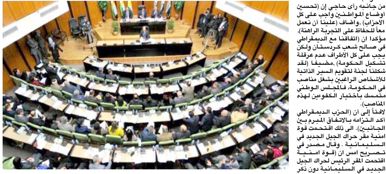
جلسة : برلمان إقليم كردستان خلال إحدى جلسات

الحزب الديمقراطي الكردستاني نيجرفان البارزاني الى السليمانية. وقال داود لـ (الزمان) امس ان (وقد توصل الوفد الى اتفاقات مشتركة). الحزب السني خلال زيارته الى السليمانية وبحسب المعلومات المتداولة في وسائل التواصل الاجتماعي (من المنتظر ان يتم ايدخالها الى مشروع القانون وستقدمه بعد ذلك الى رئاسة برلمان كردستان). وكان الحزب الديمقراطي الكردستاني، امس الأحد، على مسودة الاتفاق السياسي لتشكيل الحكومة الجديدة في إقليم كردستان. وقال النائب عن كتلة الاتحاد الوطني الكردستاني سركو آزاد في تصريح صحفي (من المنتظر ان يعقد البرلمان جلسته الاعتيادية يوم غد الأربعاء للتصويت على مشروع قانون تفعيل مؤسسة رئاسة إقليم كردستان). مناقشة تعديلات وأضاف، ان اللجنة القانونية في برلمان كردستان ستناقش اجتماعاً مناقشة بعض التعديلات التي سيتم إدخالها الى مشروع القانون وستقدمه بعد ذلك الى رئاسة برلمان كردستان). وكان الحزب الديمقراطي الكردستاني، أعلن عن ترشيح رئيس حكومة الإقليم نيجرفان البارزاني لرئاسة الإقليم خلفاً لمسهود البارزاني. كما رشح الحزب مسرور البارزاني، لشغل منصب رئيس حكومة كردستان. الذي نكش القيادي في الاتحاد الوطني الكردستاني شوان داود عن حسم اتفاق تشكيل حكومة إقليم كردستان خلال زيارة نائب رئيس