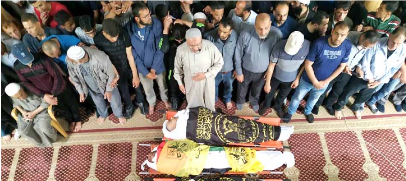
صلاة فلسطينيين يصلون على جثمان قيادي في حماس بغزة اسرائيلية

وساهم اتفاق لوقف إطلاق النار بين إسرائيل وحماس رعته مصر والأمم المتحدة في تهدئة نسبية تزامناً مع الانتخابات التشريعية في إسرائيل في التساع من نيسان. وسمحت إسرائيل بموجب اتفاق وقف النار لقطر بتقديم مساعدات بملايين الدولارات إلى القطاع لدفع الرواتب وتمويل شراء الوقود لتخفيف حدة أزمة الكهرباء.