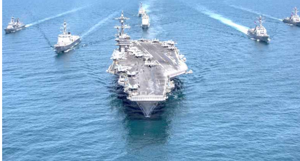
قوة: سفن قوة بحرية أمريكية تصل الشرق الأوسط

وأعيد العمل بالعقوبات ابتداءً من 8 أيار/مايو 2018مقارنة بـ 8 أيار/مايو 2018نسبة 51 بالمئة على أساس سنوي مقارنة بـ 8 بالمئة قبل عام.