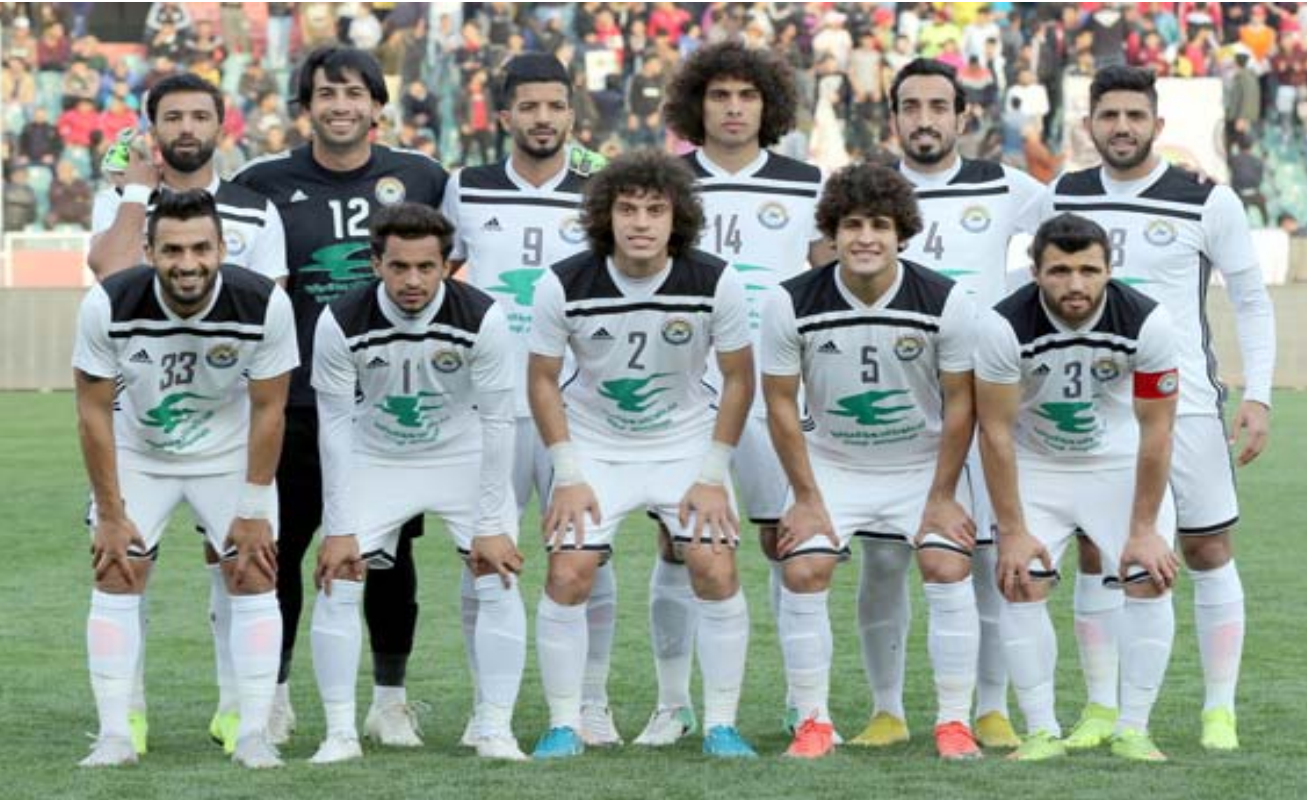
حظوظ: يطمح الزوراء الى تحقيق نتيجة ايجابية امام آهن الإيراني

تجري في كربلاء وهذا شيء مهم فقياتي لمصلحة الزوراء الذي عليه ان يقدم المستوى والنتيجة وخوض اللقاء من دون اعدار دفاعا عن سمعة الفريق والكرة العراقية بعد عودة المشاركة لاهم البطولات الآسيوية وان الامل قائم لكن بشرط ان يتمكن الفريق من التعامل مع اللقاء بثقة وحرص ويحفظ النقاط والمدرّب سيحاول الخروج بكل فوائد اللقاء على امل تعثر النصر وكسل شيء متوقع بكرة القدم.