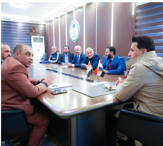
رؤساء: اللجنة الاولمبية تستضيف عدداً من رؤساء الاندية الرياضية