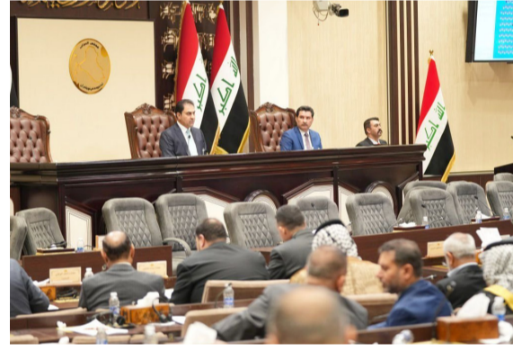
جلسة: النائب الاول يترأس جلسة النواب اليوم امس