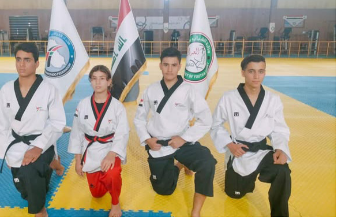
مركز: الفائزون من مركز الموهبة الرياضية بالتايكواندو في بطولة دولية