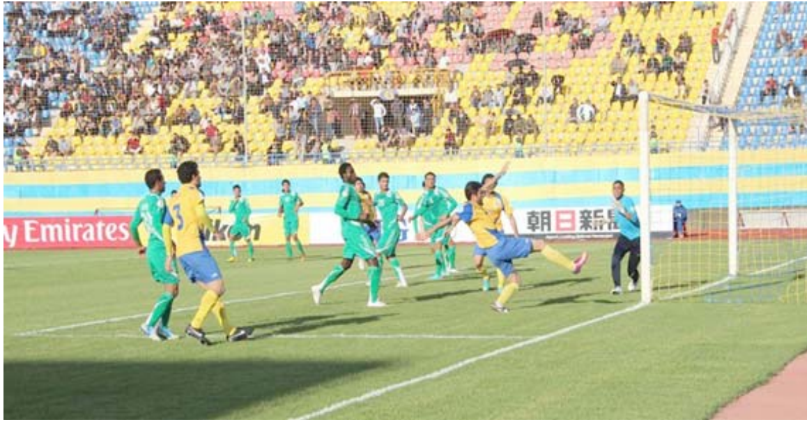
مواجهات: فريق الدوري الممتاز تستعد لمواجهة جديدة لتحسين وضعها في الترتيب

الاسبوع الماضي وما رافقها من مشاكل يامل ان يتجاوزها اللاعبون عبر العودة لسباق النتائج المطلوبة. واخر مباريات اليوم ستجري بين صاحب المركز الثاني عشر الحدود 24 والصناعات السادس عشر 27 وتظهر تحفظات ضئيلة لبقاء السماوة الذي سيبدأ في تحقيق الفوز بعد الغياب الذي شهد في الجولات الاخيرة حيث تآخر وابتعد عن النتائج المطلوبة الدور الماضي والستعاد مع الدور الحادي عشر وستويات من شأنها ان تخدم عملية البقاء المرهونة ببقاء اللاعبين من خلال تقديم العمل لمواصلة الحفاظ علة نوعية النتائج ولدعم الامر من خلال التقدم للامام على حساب الكهرياء الذي سيخسر لاريل والميناء الذي يحل ضيفا على الزوراء وهو ما يدفع الصناعة للبحث بقوة عن الفوز لتأكيد قدراته التي يامل عادل نعمة ان يوقفها لانه تآخر وابتعد عن النتائج المطلوبة وحان وقت العودة لها بعد الجيوب البصرية التي تعد مقبولة لأنها آتت من الهباب ولانه في وضع مشابه للصناعات اذا لم يكن افضل منه امام الموقع والنتائج السابقة التي يسعى استعادتها عبر بوابة الثلاثاء.