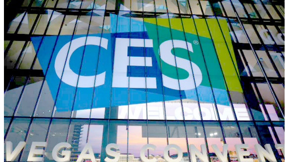
بقية الخبر على موقع (الزمان)

لايس فيغاس (الولايات المتحدة) أ ف ب - بات الفاعلون في القطاع التكنولوجي يوفرون مزيداً من الأجهزة الحديثة والتقنيات المخصصة للصحة الذهنية كجهاز يرصد الفلج أو آخر يحد من تقادم التوتر أو يسيطر على نوبات الهلع. ومن بين الشركات الناشئة المتخصصة في هذا المجال والحاضرة في معرض لاس فيغاس للالكترونيات الذي يفتح أبوابه أمام أفراد العامة الثلاثاء، نورتيكس السويديرة التي أطلقت جهاز كورتيسيس القادر على قياس مستوى الكورتيزول المعروف بهرمون التوتر. و"كورتيسيس" عبارة عن جهاز استوائي صغير على طرفه قطعة من كورتيسيس، من دون اضطراب الشخص لليلصق أو استخدامه، ثوب، ثم يحلل الجهاز اللقاب مباشرة. وبعد وضع الجهاز على اللقاع على النتائج عبر تطبيق في الهاتف المحمول.