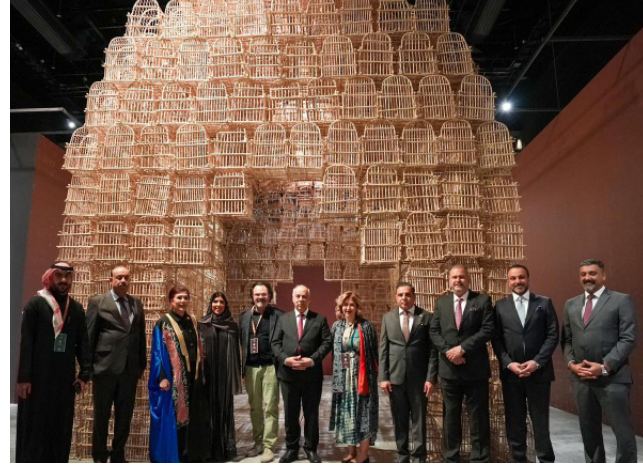
فعاليات - لقطات من فعاليات ومعرض (بين ثقافتين)

المقاعد التقليدية للمقاهي العراقية، مع لوحات تصويرية على الجدران لإحياء الصورة الذهنية المحفوظة في الذاكرة العراقية، حيث توسط صدر المقهى منصة لإقامة الندوات مع شاشة إلكترونية خلف المنصة للتعريف بالندوات و أسماء المتحدثين، وأكد في هذا فعاليات، وتوسيع الإطلاع على تجارب ابداع مسرحيين وفنانين، مبداء سروره وفخره بالجلوس على مسرح مقهى الشباندر مع زملاء في الهندسة المعمارية والتصميم الرقمي، حيث ناقشوا التقارب الثقافي والمعماري بين السعودية والعراق، وسرد تاريخي لمعالم العمارة في كلا البلدين، واستعرض الخبر تقريبا عن (العمارة العراقية بشواهد الصور والمخططات، يضم عشرة فصول تبدأ من التخطيط الحضري والتصميم المعماري مروراً بالمعالم التاريخية و مركز بغداد التاريخي).