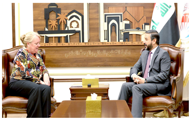
لقاء: وزير التعليم العالي خلال لقائه سفير هولندا في بغداد