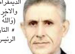
صلاح الدين الجبائي بغداد

التاريخ يقول: عندما يكذب رئيس سلطة من سلطات النظام الديمقراطي ويوافق أو يؤيده أو يسكت الرئيس الآخر والأخر فإن هذا النظام يشكو من النفاق: (والله يشهد أن المُتَأَمِّقِينَ كاذِبُونَ) (1) (المنافقون) # التاريخ يقول: الرئيس الكذاب يُهلك النظام.