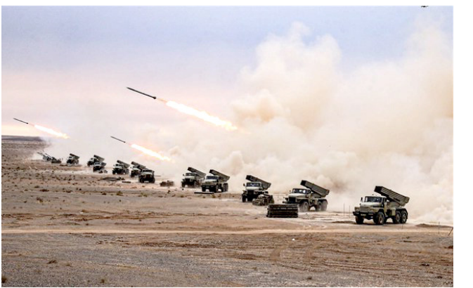
مناورات: قوات إيرانية تجري مناورات عسكرية قرب منشأة نطنز النووية