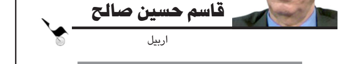
قاسم حسين صالح

ما كنت أعرف إن الحسن البصري ولد قبل سنتين من نهاية خلافة عمر بن الخطاب وتحديداً في العام واحد وعشرين من الهجرة. وفي المدينة. وما كنت أعرف أنه رحل إلى كابل، ثم خراسان وأنه كان كاتباً للربيع بن زياد في عهد معاوية بن أبي سفيان. ثم جاء إلى البصرة وسكن فيها. ومنها أخذ نسب (البصري) كان ذكياً من يوم كان صبياً، فتفقد أن يلتقي بكبار الصحابة والتابعين أمثال عبد الله بن عباس والمغيرة بن شعبة وأنس بن مالك. فأخذ العلم منهم ليصبح علماً في الحديث والفق والتفسير. وصفه ابن سعد بقوله: «كان الحسن جامعاً عالماً عالمياً رفيعاً ثقة مأموناً عادياً ناسكاً كبير العظم فصيحاً جليلاً وسيماً»، فيما وصفه معاذ بن معاذ: «ما لقيت أحداً بعد الحسن إلا صغر في عيني»، وقال الأعمش: «ما زال الحسن يبعي الحكمة حتى نطق بها، وكان إذا ذكر عند أبي جعفر - يعني الباقر - قال: ذاك الذي يشبه كلامه كلام الأنبياء». أصف لها أنه كان إماماً عالماً زاهداً عادياً، ورعاً شجاعاً يقول الحق ولا يخاف في الله لومة لائم. شاهد ذلك ما قاله عن الحجاج وتصديه لطغيانه وفضحه لسوء أفعاله، وحاكيته الغربية في لغته مع: المفارقة: إن فريقاً من الشيعة يفتنونه شيعياً وفريقاً يفتنونه سننياً، فيما هو من أروع علماء الدين وأجملهم في تاريخ الإسلام، الذي تفننوه الآن.