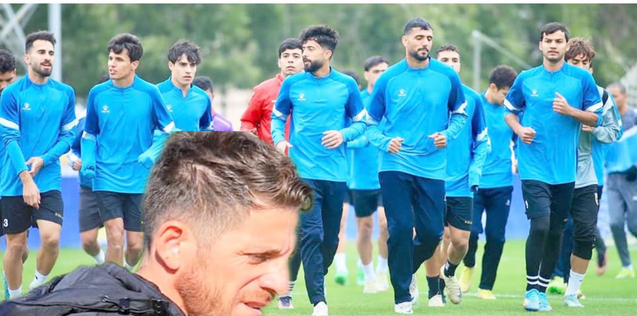
تدريبات فريق الكرخ يجري وحداته التدريبية الأخيرة قبل مواجهة القاسم في دوري المحترفين