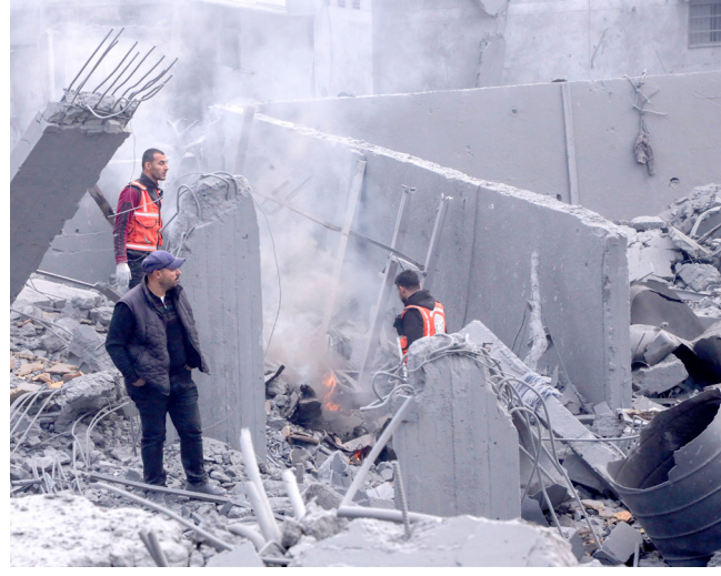
دمار: عمال الاغاثة يبحثون عن ناجين بين الابنية المدمرة في غزة

في نابلس الأحد وشهدت مناطق في شمال الضفة الغربية خلال الساعات الماضية انتشارا مكثفا للجيش الإسرائيلي في أعقاب مقتل ثلاثة إسرائيليون في هجوم بإطلاق النار بالقرب من مدينة قلقيلية الإثنين. وتصاعدت أعمال العنف في الضفة الغربية المحتلة منذ بدء الحرب في قطاع غزة إثر الهجوم غير المسبوق الذي شنته حركة حماس على إسرائيل في 7 تشرين الأول/أكتوبر 2023. وقتل مائة ما لا يقل عن 821 فلسطينيا برصاص جنود أو مستوطنين إسرائيليين، وفق بيانات السلطة الفلسطينية في الفترة نفسها، قتل ما لا يقل عن 28 إسرائيليًا من المدنيين والجنود في هجمات فلسطينية أو خلال مواجهات في الضفة الغربية، وفق أرقام رسمية إسرائيلية.