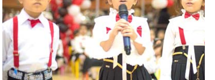
فعاليات فنية لأطفال روضة دار السلام