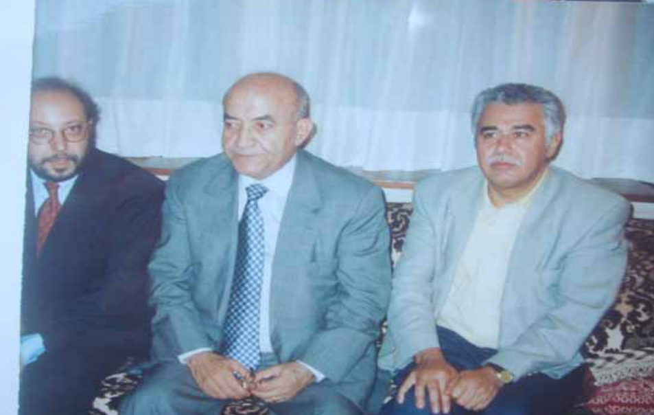
شعبان مع عبد الرحمن اليوسفي رئيس وزراء المغرب

التكليفاً ملكياً بتولي رئاسة الوزراء، وكان اليوسفي قد طلب اللقاء مع نخبة من زملائه العاملين في الإطارين ذاتها، على دعوة عشاء نظمها الأستاذ عبد العزيز البتاني في بيته، يومها تحرك في الهاجس الصحفي لسببين، الأول هو كيف يمكن لمعارض وطني قضى أكثر من ثلاثة عقود في المنفى أن يتبوأ رئاسة وزارة في عهد ما زال مستمراً وكان من أشد المعارضين له، بل داعياً لإخائه: والثاني كيف يفهم السياسي الوطني معارضته من خلال هيكل الدولة وكيف يمكن التعامل معها: بآدرت حينها إلى إثارة النقاش بسؤال الوزير الأول: الا تشعر أحياناً بالعزلة أو المحاصرة، يا " دولة سي عبد الرحمن وأنت في هذا الموقع؟ وكان جوابه، نعم والى حدود غير قليلة، لكن شفيعي أن جزءاً من خطابي ما زال معارضاً، وهو ما كنت أفسه في أحاديثه وخطبه التي تابعتها لأكثر من مرة وفي أكثر