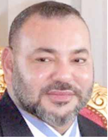
الملك محمد السادس