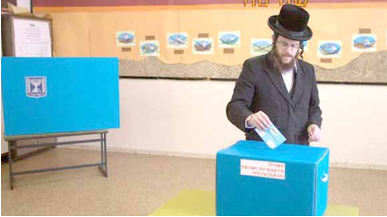
انتخابات: اسرئيلي يدي بصوته بأحد المراكز الانتخابية في تل ابيب اس.

نتانياهو "اللعبون" وتحالف الأزرق والإبيض" نفس عدد المقاعد في البرلمان المؤلف من 120 مقعداً. وبموجب هذه الاستطلاعات التي تعطي كل طرف ثلاثين مقعداً، لن يكون بإمكان أي منهما تحقيق الغالبية المطلوبة لتشكيل حكومة. وسيحتاجان إلى تشكيل ائتلاف حكومي.