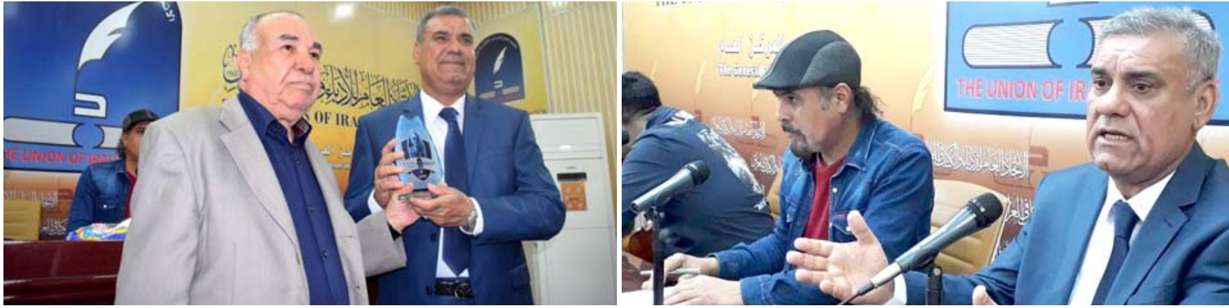
الملتقى الإذاعي والتلفزيوني يحثي برعد ميسان