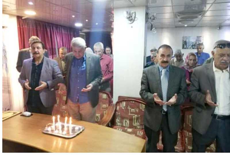
تأبين: قراءة سورة الفاتحة على صحايا عبارة الموت في اتحاد الاذاعيين

والصبر والسلوان لذوي الضحايا والشفاء العاجل للرحى ( . وقال المعتل طه المشهدي(لا اجد اية كلمة تفي بحق هولاء الابرياء الذين اخذهم نهر دجلة وخطف فرحتهم مصيبتكم هي مصيبة العراق من سابقا الكثير، انا لله وانا اليه راجعون).