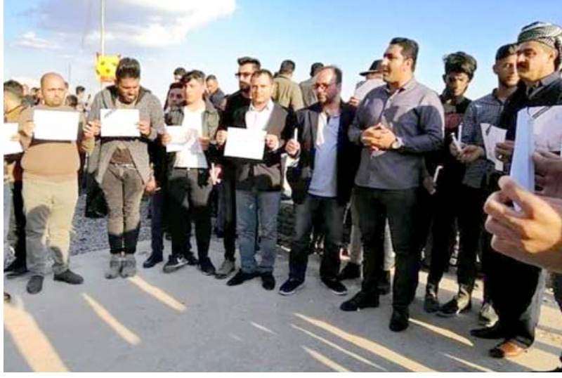
فاجعة: وقفة احتجاجية ضد الاهمال الذي تسبب بفاجعة الموصل