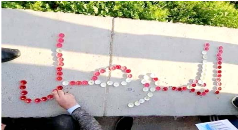
كلمة الموصل تزيّن احد اروقة قلعة اربيل