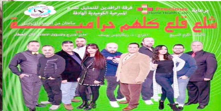
ميشغان - الزمان: استعدت فرقة الرافدين للتمثيل لتقديم مسرحية ( شلع قلع كلم حرامية ) في الخامس من نيسان المقبل لمدة ثلاثة ايام

استعدت فرقة الرافدين للتمثيل لتقديم مسرحية ( شلع قلع كلم حرامية ) في الخامس من نيسان المقبل لمدة ثلاثة ايام