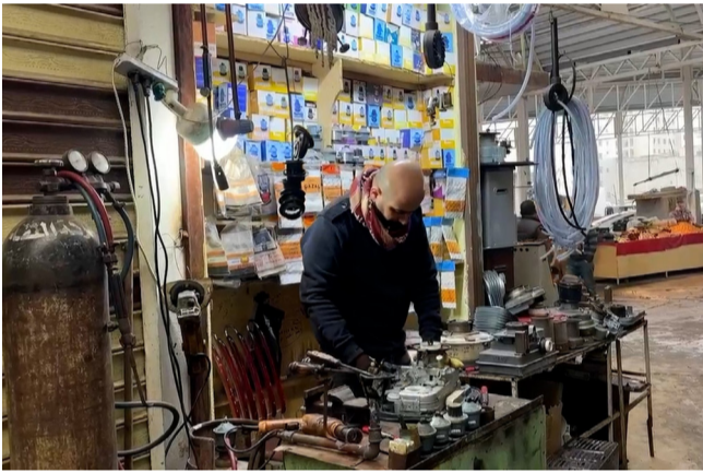
تصليح : مصلح مدافي نفطية وسط سوق كربلاء

النجف - سعدون الجابري انجز مصفى النجف التابع الى شركة مصافي الوسط أعمال الصيانة السنوية بوحدة التكرير الثانية للمصفي، مشيراً الى تشغيل الوحدة بالمصفى بالوقت المحدد. وقال مدير المصفي، لبيت عبد الرزود (الغراوي، في تصريح امس ان (مصفي ميسان التكرير الثانية تعمل بطاقة إنتاجية تبلغ 10 الاف برميل يوميا)، مبيناً أن (وحدة التكرير الثانية عدلت للعمل من جديد، بطاقة إنتاجية قصوى، بعد إنجاز الفرق الهندسية والفنية أعمال الصيانة في الوقت المحدد لها، بتعاية مدير عام الشركة، هيثم إبراهيم (محمسن)، وأعرب الغراوي عن (تقديره للجهد الملائك التشغيلية والعاملين في فريق اللجنة المركزية في وزارة النفط للمصفي، ممن بذلوا جهوداً كبيرة وعملوا بجد ووفائي بتطبيق إجراءات السلامة خلال فترة إنجاز الأعمال الفنية لفرق التكرير، والتي استمرت 19 يوماً). وتتمته وزارة النفط إلى زيادة طاقة مصفى ميسان، بإضافة وحدة بطاقة 70 ألف برميل يوميا، بحسب النائب عن المحافظة، علي سعدون اللامي، والذي ذكر في تصريح امس ان (المصفي من المفترض أن يعمل بطاقة القصوى بحجم 40 ألف برميل يوميا، مبيناً أنه (يتم العمل بواقع أربع وحدات)، مبيناً أنه (يتم حاليا بطاقة إنتاجية تبلغ 30 ألف طن يوميا، في ثلاث وحدات)، وأوضح أن