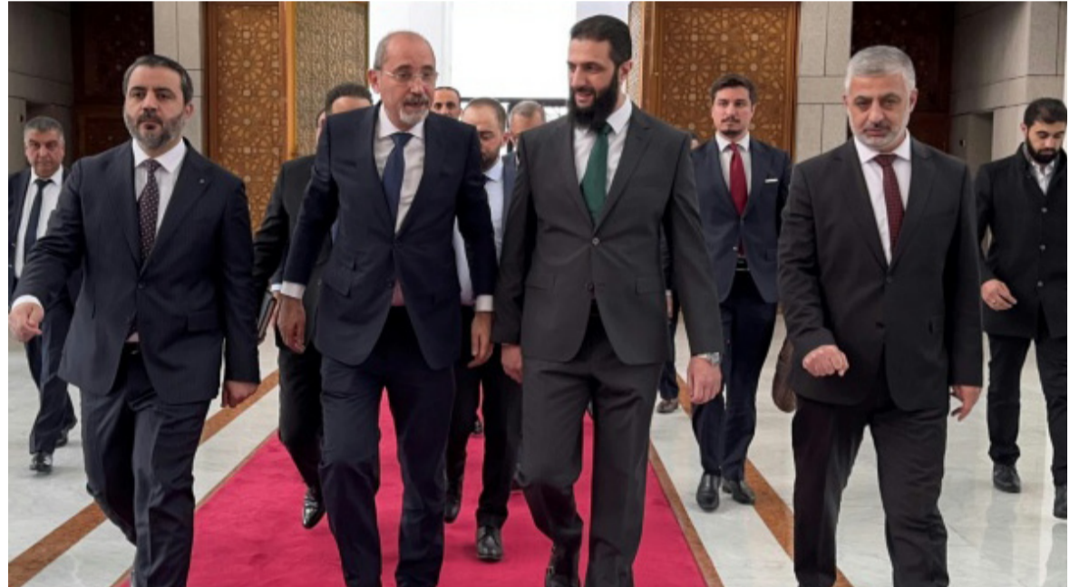
زيارة : وزير الخارجية الأردني يصل دمشق امس ويلتقي رئيس الإدارة السورية الجديدة

بغداد - قصي منذر أكد رئيس الوزراء محمد شياع السوداني، خلال مباحثات هاتفية مع رئيس دولة الإمارات العربية المتحدة الشيخ محمد بن زايد آل نهيان، ضرورة توحيد مسارات العمل العربي والتشسيق المشترك لدعم الشعب السوري. وقال بيان تلقته (الزمان) امس إن (السوداني أجرى مباحثات هاتفية مع بن زايد، تناولت أهمية بدل المزيد من العلاقات الثنائية بين البلدين، وسبل تعزيزها في مختلف المجالات، في إطار الشراكات المتجددة التي تدعم برامج التنمية والمصالحة المشتركة، إضافة إلى البحث في تطورات الأوضاع في المنطقة،