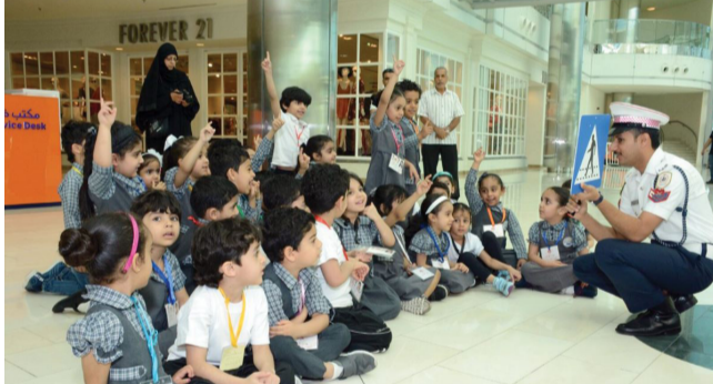
اشارات : رجل مرور يعلم التلاميذ اشارات المرور

بغداد - الزمان تواصل مديرية المرور العامة، المضي بخطتها المتعلقة بتنظيم حركة المركبات في بغداد والمحافظات، مشيرة الى السعي لإدخال منهج مروري ضمن الكتب المدرسية، وقال مدير اعلام مديرية المرور العامة، حيدر الوائلي، في تصريح امس ان (مشروع السلامة المرورية يتم العمل عليه بالتنسيق مع وزارة الداخلية)، مؤكداً (اهمية هذه الخطوة في توعية الجيل الجديد بمفاهيم السلامة المرورية، وذلك بتعزيز النظام التوعوي في المدارس والجامعات والمعاهد، فضلا عن تكثيف انتشار البوريات قرب المدارس لتأمين سلامة الطلبة خلال دخولهم وخروجهم)، بحسب تعبيره، وبشأن تنظيم حركة سير المركبات أوضح الوائلي ان (العديد من اللوحات مكتسدة في مكاتب التسجيل بسبب عدم مراجعة المواطنين لاستلامها)، ولفت الوائلي الى (عدم وجود أي