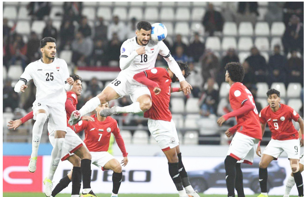
فوز المنتخب الوطني يفوز على نظيره اليمني في خليجي 26

لتخطي المنافس بعدما قدم مستوى واضح اصام الكويت فيما تتطلع قطر الى أحداث الفارق والإبقاء على تطلعاتها في المنافسة على صدارة المجموعة الإمارات والكويت وعند الثامنة والنصف تقام مباراة الإمارات وصاحب الأرض ويعول الاول على جهود عناصره في تحقيق الفوز على المنافس بين جمهوره للأهسية النقاط في دعم حظوظه في المنافسة الواحدة بطاقتي التأهل التي يبحث عنها الكويت الذي سيكون مطالب من جمهور في اغتنام الفرصة واللعب بشعار الفوز وحدة الشيء الأهم لتقديمه لجمهوره المتعطش له والسقطات لكن المهمة ليست بالسهلة.