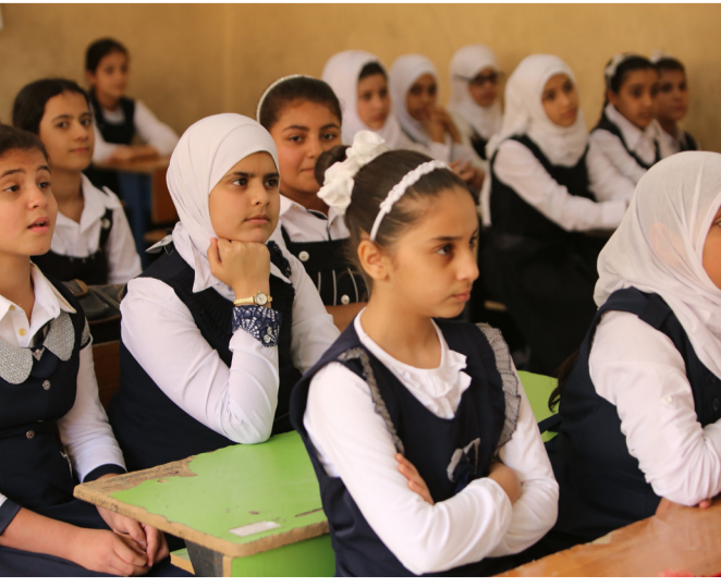
مدينة: مدرسة البنات في مدينة الموصل

واضاف عيسى ان المعلم يجب ان يكون بئزلة ارفع من ان يقدم يده لمعلمهم باعطاء الموظف الحلويات التي كانت بحوزته لذلك فالمعلم بعيد تماماً عن تلك المبادرات ونأمل ان تبعد عن بعض المدارس الحكومية عن تقليد ما ينشر بمواقع التواصل كون هنالك تعليمات واضحة من وزارة التربية بمنع تصوير التلاميذ او اي فعاليات تجري لعللاقة لها بالتعليم طالباً ان تخضع تلك المنشورات التي انطلقت من بعض المدارس الحكومية للمسائلة والتحقيق من الجهات ذات العلاقة.