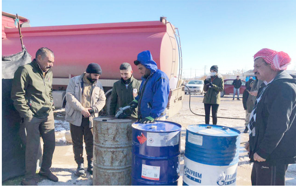
تجهيز: مواطنون ينتظرون الحصول على وقود