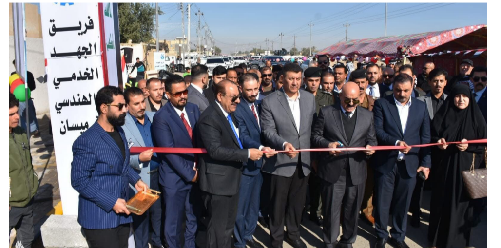
افتتاح: مسؤولون في ميسان خلال افتتاح منظمة كصيبة