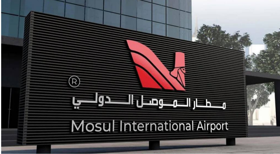
بوابة : تصميم اولي لمخزل مطار الموصل الجديد

رئيس الوزراء يفتتح مبنى محافظة نينوى ويزور السور الأثري