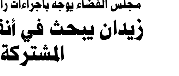
أنقرة - ماهر أوغلو بغداد - الزمان