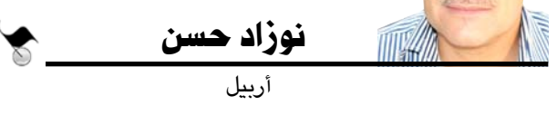
نوزاد حسن أربيل