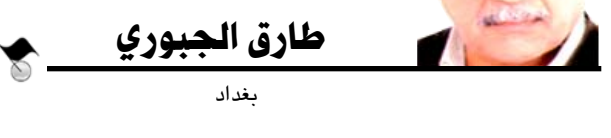
طارق الجبوري بغداد