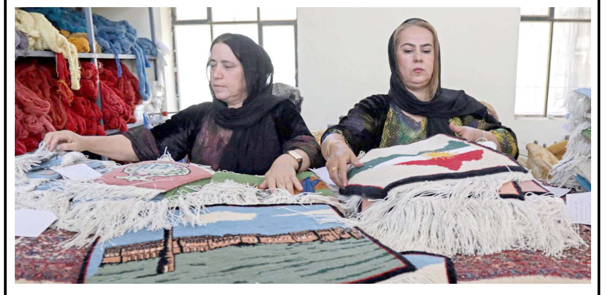
مصنع: نساء كرديات يسجن السجاد يدوياً في مصنع تقليدي بأربيل

يسود التشكيك على تفاهات بغداد وأربيل بشأن حصة إقليم كردستان من الموازنة الخلاقية