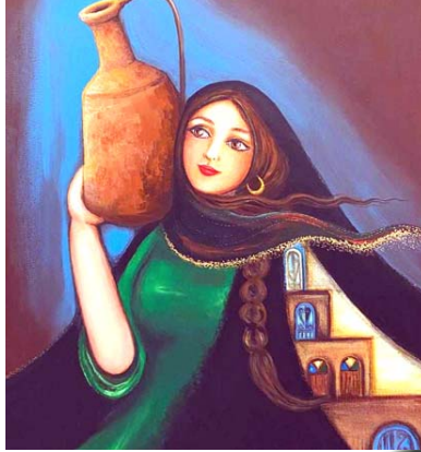
تشكيل: لوحات بريشة ميسون الربيعي