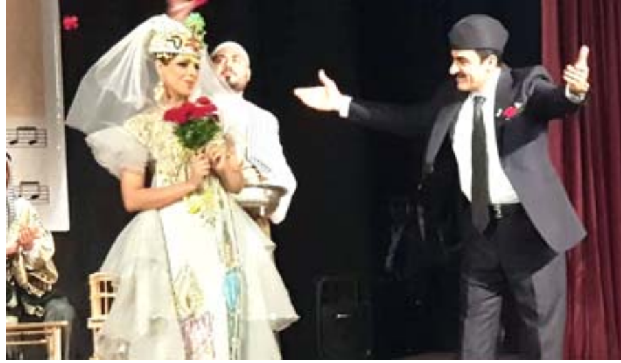
حفل متميز: تناغم بين الموسيقى والأزياء، في حفل بمناسبة عيد الحب