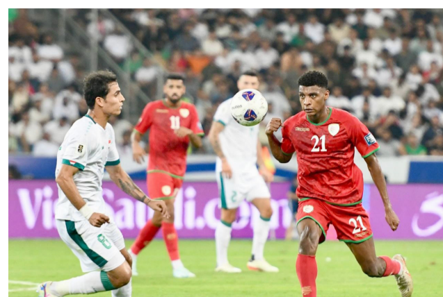
مباراة احدى مباريات المنتخب الوطني بكرة القدم في تصفيات كاس العالم

جانبه يعلم لاعبو النفط مهمتهم وتأكيد أنهم جاهزون للعب وللدفاع عن الصدارة والبقاء فيها ما أمكن وذلك بتحقيق الأهم في مواجهة لا تخلو من التحديات التي سيعمل المضيف على تكريسها لعرقلة المهمة وتحقيق النتيجة المثالية لكن النفط سيدخل ويلعب في أفضل حالته ويريد تحقيق ثلاث نقاط عالية وحدها من تكفل له اللقاء في المقدمة وقبلها توسيع الفارق مع ملاحقيه وإن المواجهه تأتي في وقتها في ظل ارتفاع معنويات اللاعبين بعد التقدم للقاء فيما سيلعب دبالي بنشعار الفوز لاغير بعدما عاد بنقطة من كربلاء يريد منها أن تكون داعما للفريق في تغير المسار .