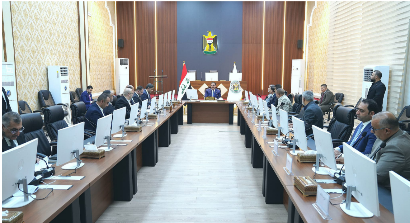
اجتماع: وزير التجارة يترأس اجتماعاً ضم الملاكات المتقدمة في الوزارة

في المحافظات الأخرى، وتابع البيان، أن (التطبيق على الهاتفي المحمول يتضمن معالجات فنية إذا كان هناك أحد أفراد الأسرة خارج البلد أو في محافظة أخرى، فيتم إرسال الرابط من قبل رب الأسرة لإضافته والتحديث بشرط أن يكون المواطن حامل البطاقة الموحدة).