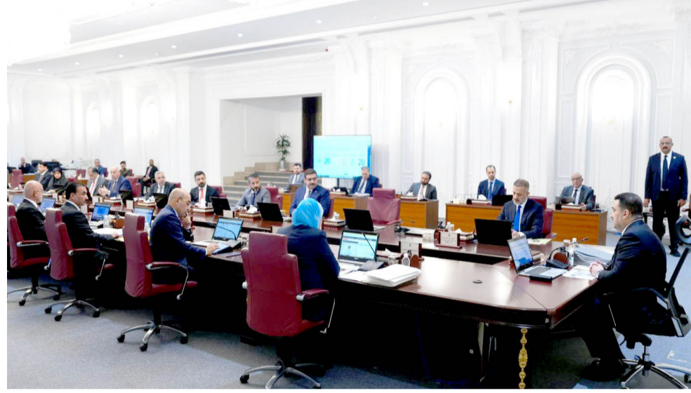
جلسة: جانب من جلسة مجلس الوزراء الاعتيادية

في اعلانه عن النتائج الأولية للتعديل العام للسكان ذكر السيد رئيس الوزراء ان (النتائج تكشف عن دخول العراق مرحلة الارتفاع الديموغرافية بوصول نسبة السكان في سن العمل إلى 60 بالمئة)، ما الذي تخفيه لنا هذه النتيجة؟ هل ستكون نقطة تحول نحو مستقبل مزدهر، ام انها ستزيد من تعقيد المشاكل التي يواجهها العراق؟