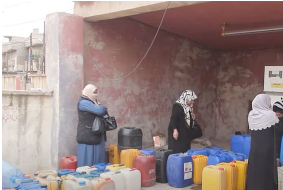
وقود: مواطنون ينتظرون في أحد محطات تجهيز الوقود في مدينة الموصل لاستلام حصصهم

الإجراءات المتعلقة بتطوير تلك الممتلكات، وتعزيز نسب الأرباح المتحققة منها).