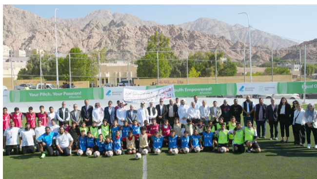
فئات: اتحاد غرب آسيا يزور إحدى ملاعب الفئات العمرية لكرة القدم

المرتکز على التأثير الاجتماعي، مما يمكن المدربين من تخطيط وتصميم وتنفيذ جلسات رياضية تستجيب للخصائص الاجتماعية وتلبي احتياجات مجتمعهم.