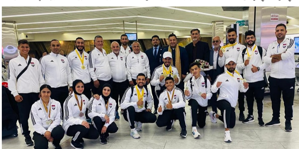
اوسمة: منتخب الكانوي يصل الى بغداد متوجاً بالاسمة الذهبية