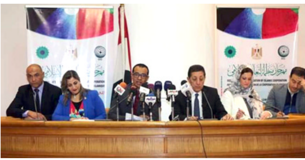
فعاليات متعددة: مؤتمر صحفي يسبق انطلاق مهرجان منظمة التعاون الإسلامي مع المصق الترويجي له (الزمان)