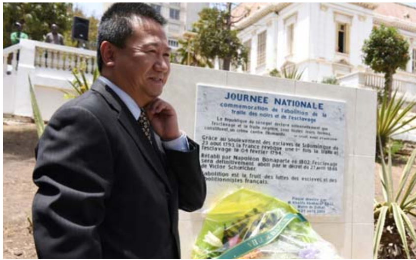
الديبلوماسي الصيني موانغ تشيا

وهي المكافئة التي كانت تحتلها اليابان. وبلغت حصة الصين حالياً من موازنة عمل الأمم المتحدة 12% و15 بالمئة من موازنة عمليات حفظ السلام والصين العضو الدائم في مجلس الأمن الدولي تملك حق النقض وهي مساهم كبير أيضاً في إرسال قوات ضمن مهام حفظ السلام التابعة للأمم المتحدة حيث ينتشر أكثر من 2500 جندي صيني ضمن بعثات في مالي وجمهورية الكونغو الديمقراطية وجنوب السودان ولبنان ومنطقة البحيرات العظمى التي تحاول الأمم المتحدة إرساء الاستقرار فيها منذ عدة سنوات تضم دولا مثل بوروندي وأوغندا وجمهورية الكونغو الديمقراطية ورواندا. وسيخلف