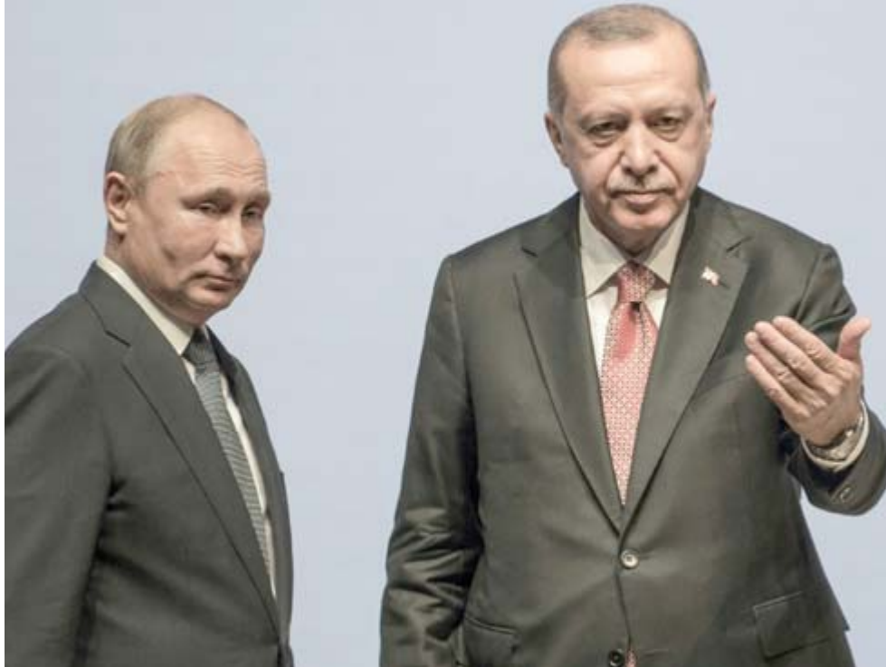
منطقة: بوتين وأردوغان يبحثان رغبة تركيا إنشاء منطقة آمنة في شمال سورية

إيجاد حل سياسي للحرب المستمرة منذ سبعة أعوام، وقد وافقت روسيا وتركيا على تنسيق عملياتهما الميدانية في سوريا بعد إعلان الرئيس الأميركي دونالد ترامب المسؤولين باقتراحها إقامة "منطقة آمنة" في شمال سوريا لمنع أي حكم ذاتي كردي على الحدود. ويقتض الرئيسان على طرفي نقض من الأمانة السورية، فروسيا تقدم الدعم للحكومة السورية بينما تدعم تركيا المسلحين المعارضين الذين يجاريون نظام الرئيس بشار الأسد. ورغم الخلافات يؤكد البلدان انهما يعملان معا وبشكل وفعال على