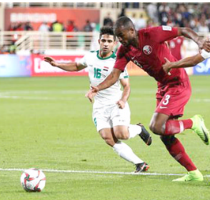
جانب من مباراة المنتخب العراقي أمام نظيره القطري