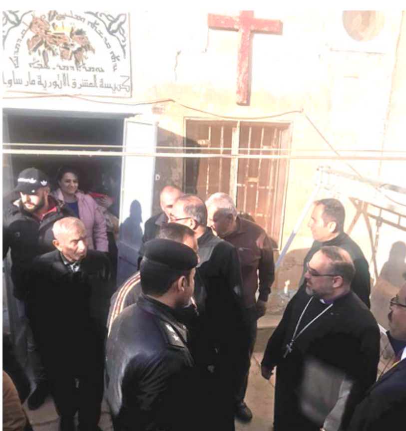
كنيسة: عراقيون في مبادرة داخل إحدى كنائس الأنبار