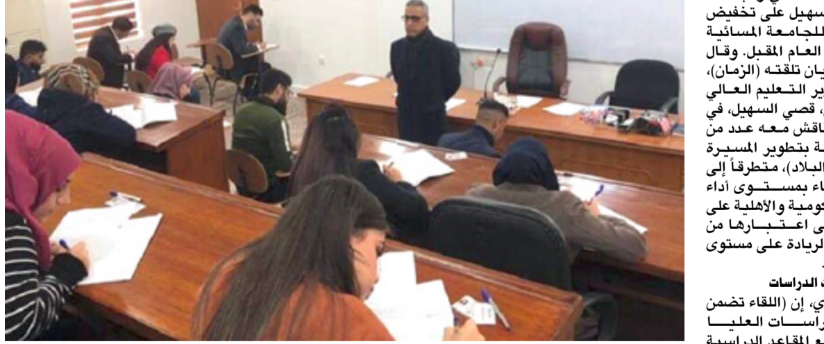
محاضرة: شهدت الكلية الادارية التقنية بالجامعة التقنية في السليمانية أول محاضرة (أون لاين)

بغداد- الزمان اعلنت وزارة التعليم العالي والبحث العلمي ونواها الى (اهمية التجربة التي اعتدوا و استهدف والحفاظ على الشخصية المعنوية التي يتمتع بها الأستاذ الجامعي داخل مؤسسته التعليمية وخارجها). من جهته اعلن النائب عن محافظة ديالى، برهان العموري، موافقة وزير التعليم العالي والبحث العلمي قضي السهليل على تخفيض اجور الدراسة لجامعة المسائية والأهلية خلال العام المقبل. وقال العموري في بيان تلقته (الزمان)، انه (التقى بوزير التعليم العالي والبحث العلمي، قضي السهليل، في مقر الوزارة وناقش معه عدد من الملفات الخاصة بتطوير المسيرة التعليمية في البلاد). منطوقاً إلى (سبل الارتفاع بمستوى أداء الجامعات الحكومية والأهلية على حد سواء على اعتبارها من جامعات ذات الريادة على مستوى جامعات العالم).