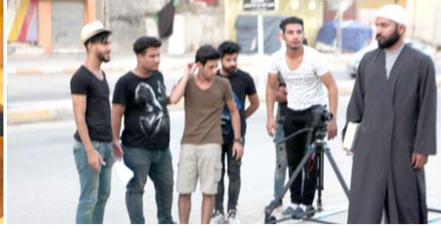
سينما الشباب: كواليس تصوير (هوم سكس) و (عركجين)

لكن لا يوجد فيها صراع الاماكن وهناك طرح للاحداث لكن دون معالجة. وتضمن المخرج عزام صالح (ان تكون هناك ورش خاصة للمخرجين الشباب حول كتابة السيناريو). وفي نهاية الجلسة تم تكريم المخرجين بشهادتين تقديريتين والتقاط الصور التذكارية.