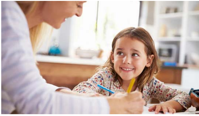
طرق : التعلم هدف تسعى اليه الطرق الحديثة

مرحلة المراهقة، فالامر أكثر تعقيداً. فهم يعانون من المزاج المتقلب في هذه السن وكذلك التوتر والقلق والخوف من الاستحسان والمعدل الواجب الحصول عليه)مضيفين ( من أجل هذا، هناك نصائح لمساعدتهم في التعامل مع تلك التحديات وقت الامتحانات: وهي ان مقدار معقول من التوتر مفيد، فالقدر المعقول من التوتر يدفع الطالب لاهتمامه بتحقيق النتائج المرجوة. فإذا تمتع بدرجة مناسبة من التوتر والقلق سوف يبذل جهداً لتحقيق تلك المهمة. اما إذا زاد التوتر عن الحد المطلوب فربما تعرض لضغط عصبي وأثر أيضاً على أفراد الأسرة بهذا الضغط وأضرهم كثيراً. وإذا انعدم التوتر ولم يشعر الطالب بالقلق أبداً حيال النتيجة فلن يهتم على الاطلاق كما يجب السماح للابناء بممارسة نشاط ما ينفسون به عن ثورتهم: لانساف، وللمتجميع قوة سحرية لا تخيب أبداً. كلما كان الأهل إيجابيون مع ما ينجزونه الأبناء في المدرسة ، فإن ذلك سيفيدهم للاهتمام أكثر وأكثر وسيحبون ان يكونوا دائماً عند حسن ظن الأهل.