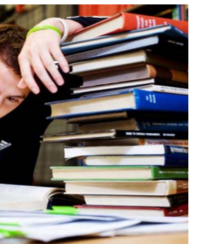
كتب: كثرة الكتب دون تدريس حقا جسيم