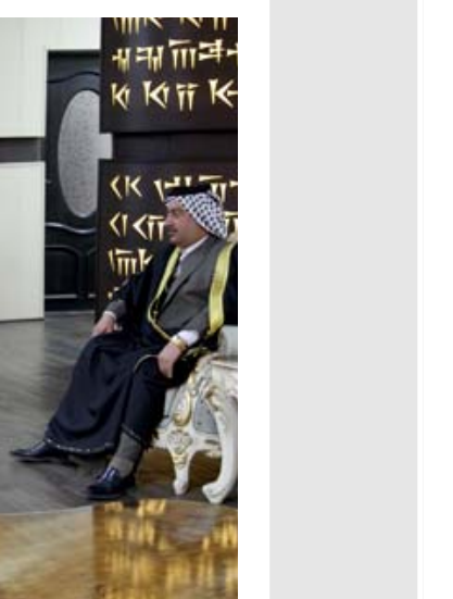
استقبال وزير الزراعة مستقيل وفد مزارعي البصرة

ممشاة حقلية واقام المركز الإرشادي في بايل مشاهدة حقلية حول اكارن بذور أصناف وسلالات الفصاء على البطالة إذ ان تنفيذها ودعمها يساعد الدولة على تشغيل اعداد كبيرة من الشباب وتشجيع المنتج الوطني وتحسين دخل الفرد والحد من تدفق العملة الصعبة الى خارج البلاد وبالتالي دعم العملة المحلية. وأشار البيان الى انه (تمت مناقشة البيات بدعم وتوسيع هكذا مشاريع عن طريق إنشاء صندوق تمويل خاص يسمى صندوق تمويل المشاريع الصغيرة والمتوسطة ويكون تمويله عن طريق المصارف الأهلية المعتمدة والموقوفة في العراق بالإضافة الى المصارف الحكومية، وضرورة توجه الدولة نحوها حيث ان هذه المشاريع تعتمد دول العالم المتقدمة، وتم التطرق كذلك الى عدد من الأمثلة حول المشاريع الصغيرة التي تحض الجانب الزراعي وبالإمكان اشباعها من قبل الشباب والعاطلين عن العمل مثل مشاريع تربية الدواجن والاسماك وتربية النحل وتسويق التمور ونسك مشاريع تربية الاعلاف حيث تستجم جميعها في تقبل البطالة و. وازداد في منطقة الجوابر بالبصرة . وازداد