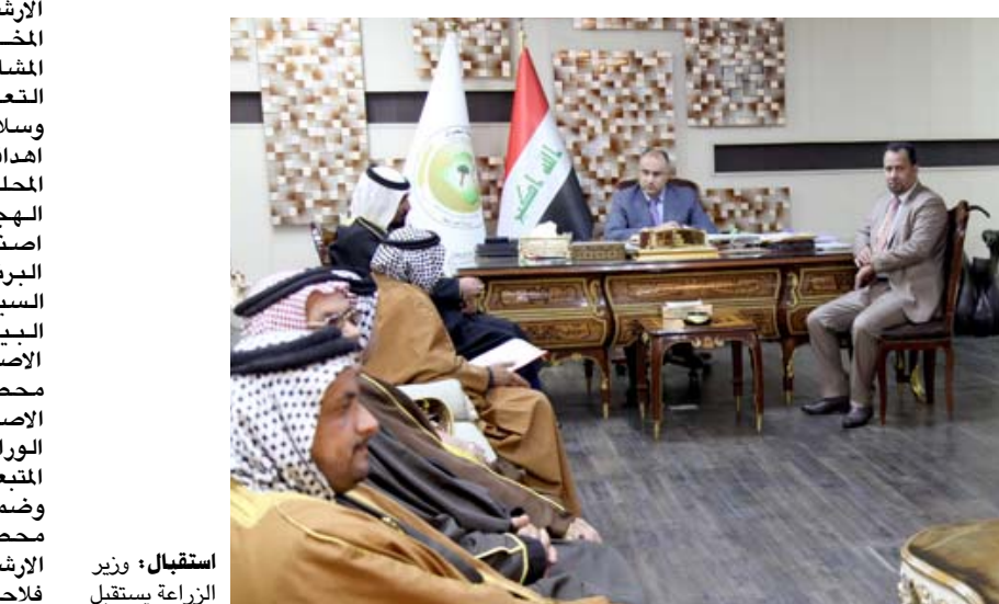
استقبال وزير الزراعة مستقيل وفد مزارعي البصرة

ممشاة حقلية واقام المركز الإرشادي في بايل مشاهدة حقلية حول اكارن بذور أصناف وسلالات الفصاء على البطالة إذ ان تنفيذها ودعمها يساعد الدولة على تشغيل اعداد كبيرة من الشباب وتشجيع المنتج الوطني وتحسين دخل الفرد والحد من تدفق العملة الصعبة الى خارج البلاد وبالتالي دعم العملة المحلية. وأشار البيان الى انه (تمت مناقشة البيات بدعم وتوسيع هكذا مشاريع عن طريق إنشاء صندوق تمويل خاص يسمى صندوق تمويل المشاريع الصغيرة والمتوسطة ويكون تمويله عن طريق المصارف الأهلية المعتمدة والموقوفة في العراق بالإضافة الى المصارف الحكومية، وضرورة توجه الدولة نحوها حيث ان هذه المشاريع تعتمد دول العالم المتقدمة، وتم التطرق كذلك الى عدد من الأمثلة حول المشاريع الصغيرة التي تحض الجانب الزراعي وبالإمكان اشباعها من قبل الشباب والعاطلين عن العمل مثل مشاريع تربية الدواجن والاسماك وتربية النحل وتسويق التمور ونسك مشاريع تربية الاعلاف حيث تستجم جميعها في تقبل البطالة و. وازداد في منطقة الجوابر بالبصرة . وازداد