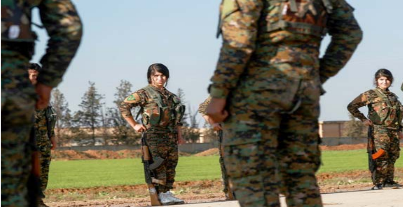
دفعه مقاتلات من وحدات حماية المرأة الكردية خلال مراسم دفن مقاتل في محافظة الحسكة

في البيت الأبيض جون بولتون خلال زيارة إلى إسرائيل أن الانتحار الأميري من سوريا يجب أن يتمّ عن ضمانة الدفاع عن خلفاء واشنطن وفي مقدمتهم إسرائيل والاكراد.