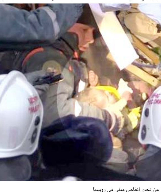
إنتشال: رجال الإنقاذ ينتشلون رضيعاً من تحت أنقاض مبنى في روسيا

وأعلن الحاكم دوبروفسكي امس حداد الأربعاء بتخلله تكثيب الاعلام والبغاء الانشطة الترفهية. وأعزت الكارثة روسيا في أجواء من الحزن، في حين كانت البلاد تستعد لاستقبال العام الجديد باحتفالات ضخمة. وماغنتيغورسك الواقعة في جبال الأورال الخنيفة بالمواد الأولية يقطنها حوالي 400 ألف