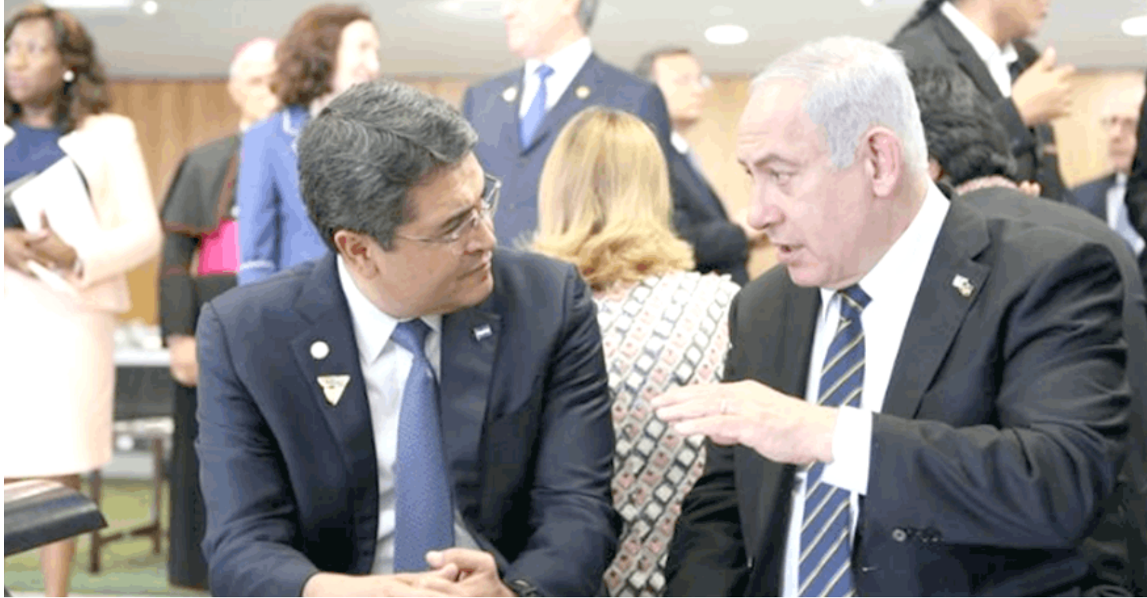
لقاء: رئيس هندوراس ورئيس وزراء اسرائيل خلال لقائهما في هنداروس

▢ برازيليا – أ ف ب – ناقشت هندوراس امس مع إسرائيل والولايات المتحدة مسألة نقل سفارتها من تل أبيب إلى القدس، في مبادرة مثيرة للجدل تأتي بعد خطوة مماثلة قامت بها واشنطن، وفق ما أفاد مسؤولون.