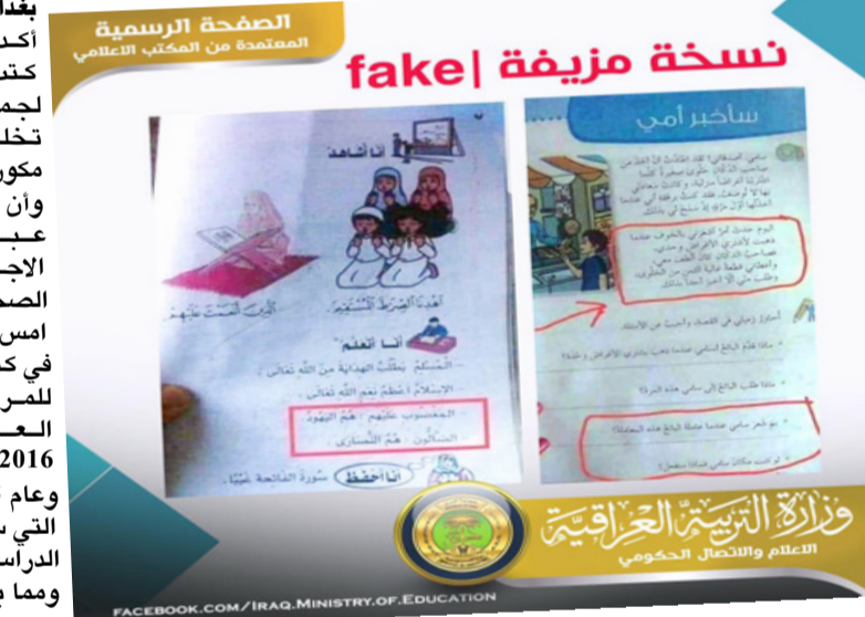
نسخة مزيفة fake

بغداد - الزمان أكدت وزارة التربية ان الكتب التربوية الاسلامية لجمع المراحل الدراسية تخلو من اي اساءة لاي مكون في المجتمع العراقي وان ما يروج له البعض عبر مواقع التواصل الاجتماعي عار عن الضحة، وذكر بيان الوزارة ان (الطبعات المعتمدة في كتب التربية الاسلامية للمراحل كافة هي طبعة العام الدراسي 2017/2018 وعام 2018/2019 والطبعة التي ستعتمد في العام الدراسي المقبل 2020/2019 وما يؤسف له استمرار