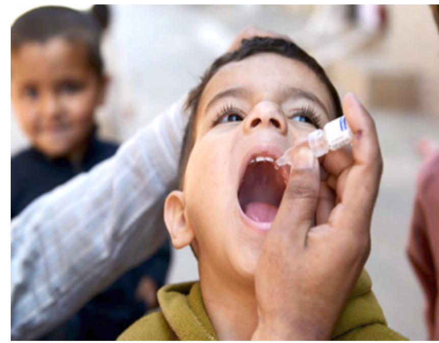
تلقيح : طفل يتم تلقيحه في بغداد