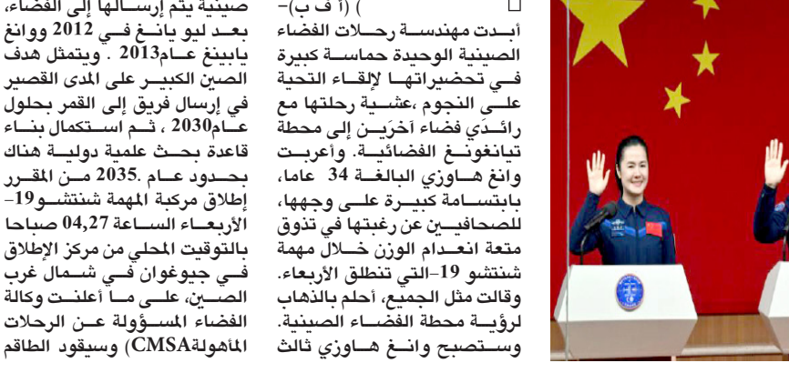
رائدة صينية إلى الفضاء، بعد ليو بانغ في 2012 ووانغ سيرافقه رائد الفضاء سونغ لينفونغ، وهو طيار سابق في القوات الجوية يبلغ 34 عاماً، وزميلته وانغ هاويزي، وهي حالياً مهندسة رحلات الفضاء الوحيدة في الصين، وفق الوكالة. وقد ظهر رواد الفضاء الثلاثة، مرتدين بزيت زرقاء تحمل العلم الأحمر الصيني، أمام الصحافيين خلف الزجاج لتجنب أي خطر عدوى قبل المغادرة. وأكد رائد الفضاء المخضرم كاي شوزهي أن الطاقم "مستعد تماماً ذهنياً وفتياً

صينية يتم إرسالها إلى الفضاء، بعد ليو بانغ في 2012 ووانغ سيرافقه رائد الفضاء سونغ لينفونغ، وهو طيار سابق في القوات الجوية يبلغ 34 عاماً، وزميلته وانغ هاويزي، وهي حالياً مهندسة رحلات الفضاء الوحيدة في الصين، وفق الوكالة. وقد ظهر رواد الفضاء الثلاثة، مرتدين بزيت زرقاء تحمل العلم الأحمر الصيني، أمام الصحافيين خلف الزجاج لتجنب أي خطر عدوى قبل المغادرة. وأكد رائد الفضاء المخضرم كاي شوزهي أن الطاقم "مستعد تماماً ذهنياً وفتياً