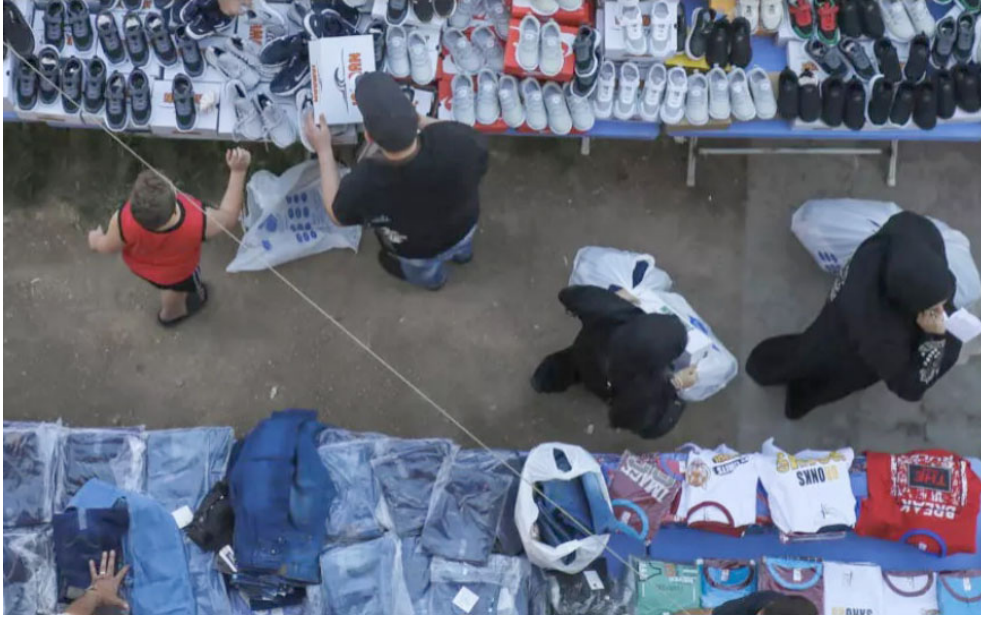
مساعداً: لبنانيون يتلقون مساعدات