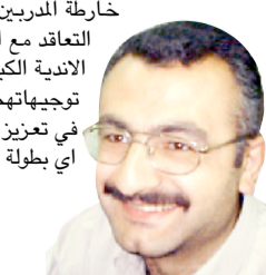
المنتخب الوطني يتقدم في تصنيف فيفا