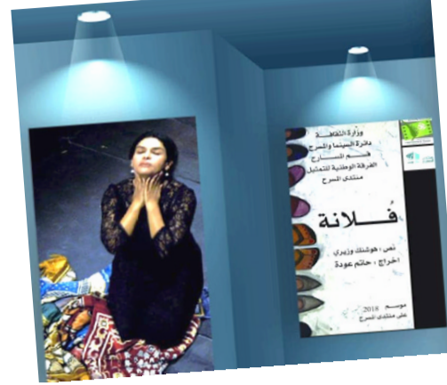
عرض: جانب من العرض المسرحي (فلانة) والمصق الترويجي لها (الزمان)