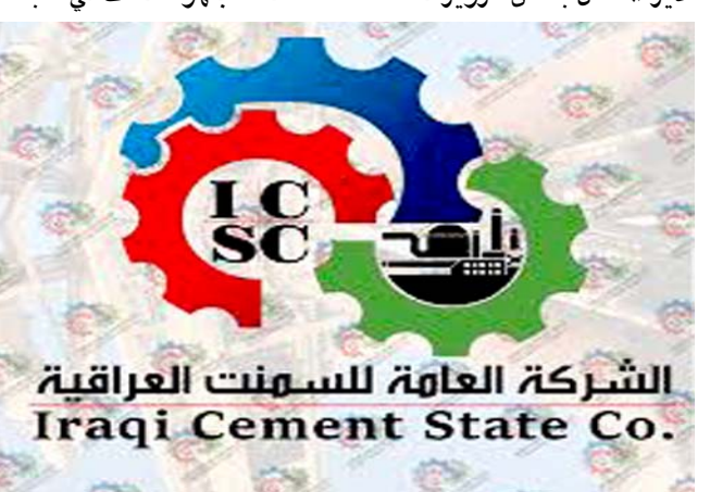
شعار الشركة العامة للسمنت العراقية

البيع التي طالب بمبلغها ص . م . ع وصدّر الحكم لصالح مدير العمل وصدّرت اوامر قبض وتحري بحق المدعو نفسه وكذلك بحق المدعو . ف م لتزويرها قائمة البيع) ونوه البيان الى ان (مجموعة مسلحة مجهولة قامت في شباط