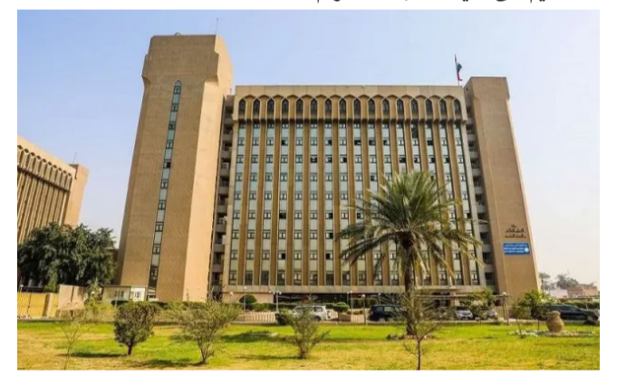
مشروع احد مشاريع ميسان قيد الانجاز

بغداد - الزمان أعلنت وزارة التعليم العالي والبحث العلمي إطلاق إستمارة التقديم الإلكترونية إلى قناة خريجي مدارس التميزين و كلية بغداد الدارسين باللغة الإنكليزية لخدمة الطلبة الراغبين في الالتحاق بالدراسات والالتحاق بالدراسات الحكومية للقبول في كليات المجموعة الهندسية وخمس درجات عن الحد الأدنى للقبول في باقي التخصصات. وفي الوقت الذي يستمر فيه التقديم إلى غاية انتهاء الدوام