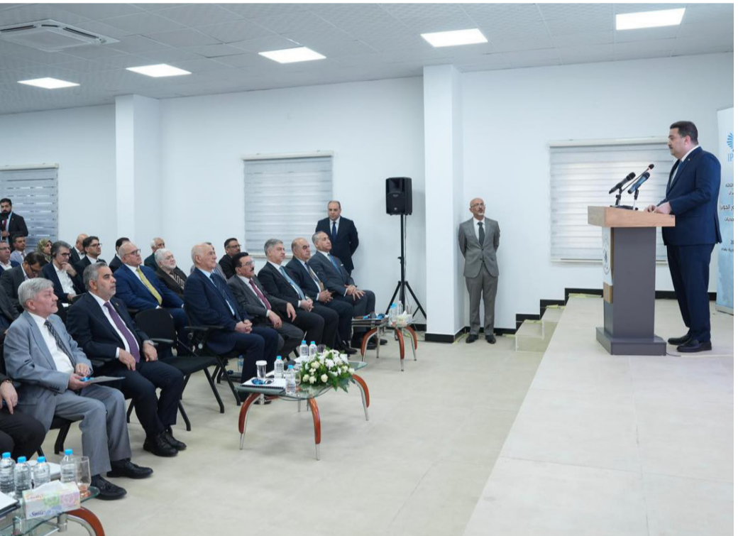
طاولة : رئيس الوزراء يلقي كلمة في الطاولة المستديرة بشأن إدارة هور الحوزية

بغداد - ابتهاج العربي أكد رئيس الوزراء محمد شياع السوداني، أن الحكومة وقعت اتفاقيات عديدة بشأن البيئة وضمان حصة العراق المائية، وأشار إلى أن الحكومة عملت على إعادة تقييم الوضع البيئي للاهوار، وقال السوداني خلال افتتاحية الطاولة المستديرة التي يقمها ملتقى بحر العلوم للحوار، بشأن الإدارة المشتركة لهور الحوزية - الروية - الفرس - النجدات وحضرتها (الزمن) أمس أن (الحكومة عملت على إعادة تقييم الوضع البيئي للاهوار، ووضع برامج لنقح آثار التحويلات المناخية عنها، والتحرك الداخلي والخارجي لدعم هذا الملف، والعمل على ضمان استمرار تغذية الأهوار بالمياه، بعد موجات الجفاف التي أصابت الكثير منها، بما في ذلك دعم السكان المحليين، وتوفير مستلزمات الحياة الخاصة بهم وبمواشيهم، بجانب العمل الدؤوب