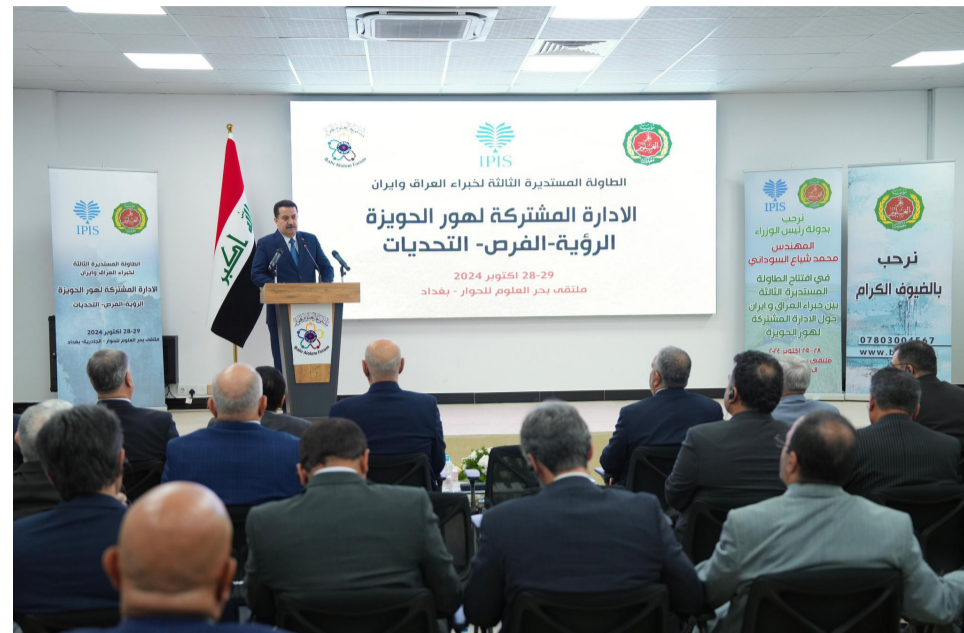
جلسة : رئيس الوزراء يلقي كلمته في الطاولة المستديرة عن هور الحويزة

التوصيات، التي تستكمل تلك التي تم التوصل إليها في أعمال طاولة النجف وطهران، التي وصلها قبل اشهر وفد من الخبراء والاكاديميين العراقيين للعرض ذاته واستهلكت الجلسة الافتتاحية بنحو عشر كلمات قدمها كل من راعي النشاط المشترك العام على مركز بحر العلوم للحوار الدكتور ابراهيم بحر العلوم ورئيس الوزراء محمد شياع السوداني ووكيل وزارة الخارجية الإيرانية ووزير الموارد المائية، والوكيل الفني لوزارة البيئة جاسم الفلاحى الذي قدم بحثاً مطولاً عن الآثار السلبية لظاهرة الاحتباس الحراري والتصحر، واستطرد في بيان تداعياتها وتأثيرها الاقتصادية والاجتماعية والامنية، وأكد انها تهدد السلم الاهلى داخل المنطقة الواحدة والامن الغذائي والوقومي.