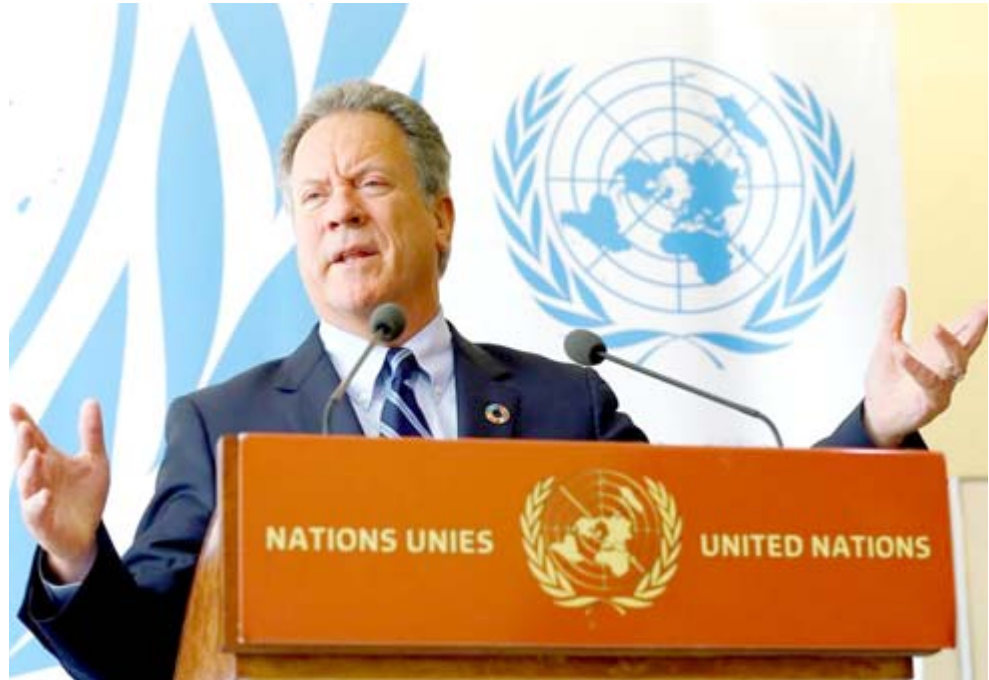
كلمة: ديفيد بيترز المدير التنفيذي لبرنامج الأغذية التابع للأمم المتحدة خلال كلمته أمام الجمعية العامة

إجراء يهدف لبناء الثقة. وكانت الولايات المتحدة وبريطانيا وقوى غربية أخرى قد مارست ضغوطاً على ولي العهد السعودي محمد بن سلمان لوقف الحرب في اليمن في أسرع وقت وذلك في غضون معارك ضارية كانت قوات التحالف تخوضها بهدف السيطرة على ميناء الحديدة الذي يستقبل أغلب المعونات القادمة إلى البلاد. وخلال الأسبوعين الماضيين مسؤولين أمريكيين على رأسهم مايك كومينيو وزير الخارجية وجيريمي هانت وزير الخارجية البريطاني لحزم على وقف المعارك في اليمن.