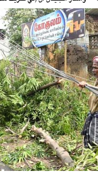
اضرار: هنود يقومون برفع الانقاض والاضرار التي تسبب بها اعصار جاجا

بشكل خطير من الساحل التركي. وهزم معظم السياح من المنطقة خوفا من العواصف العنيفة، وأوضح البيان انه (نادرا ما تقتشل الأعاصير في البحر المتوسط لذلك فان هذا الإعصار حدث قبالة ساحل تركيا لأول مرة منذ سنوات عدة). وأشار البيان ان (في خريف هذا