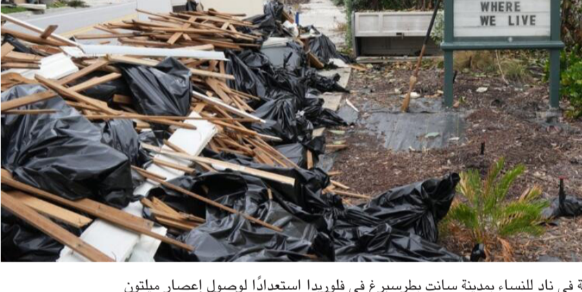
العاصم : لافتة تحذيرية في ناد للنساء بمدينة سانت بطرسبرغ في فلوريدا استعداداً لوصول إعصار ميلتون

الإيواء والملاذ الآمنة والبيت الآمن ودور الدولة ورعاية الأيتام وكبار السن) (عدد المشمولين بقانون الرعاية الاجتماعية وصل إلى (أكثر من مليوني أسرة، بخلاف له الرعاية الصحية والتربية والتعليم، موزعة بين مليون 500 أسرة يعيها رجل، و50 ألفا و430 أسرة تعيها امرأة). وشهدت في القل (تواجه تحديات في ما يخص ذوي الإعاقة، لذا نتمدد قانن هيئة ذوي الإعاقة في سد الاحتياجات الأساسية ومجهم بالتجمع وتأييهم). وقالت سجناد إن (عدد المستفيدين من قانون الهيئة، من خلال راتب المعين المتفرغ، الذي وصل إلى ما نحو 500 ألف شخص يتسلمون راتباً للتفرغ لإعانة شخص ذي إعاقة).