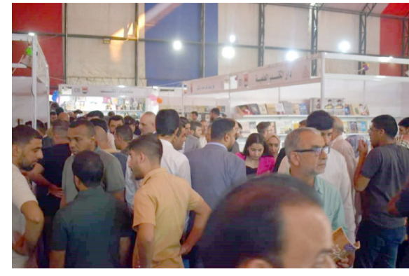
لقطات من معرض الكتاب والتكنولوجيا الحديثة