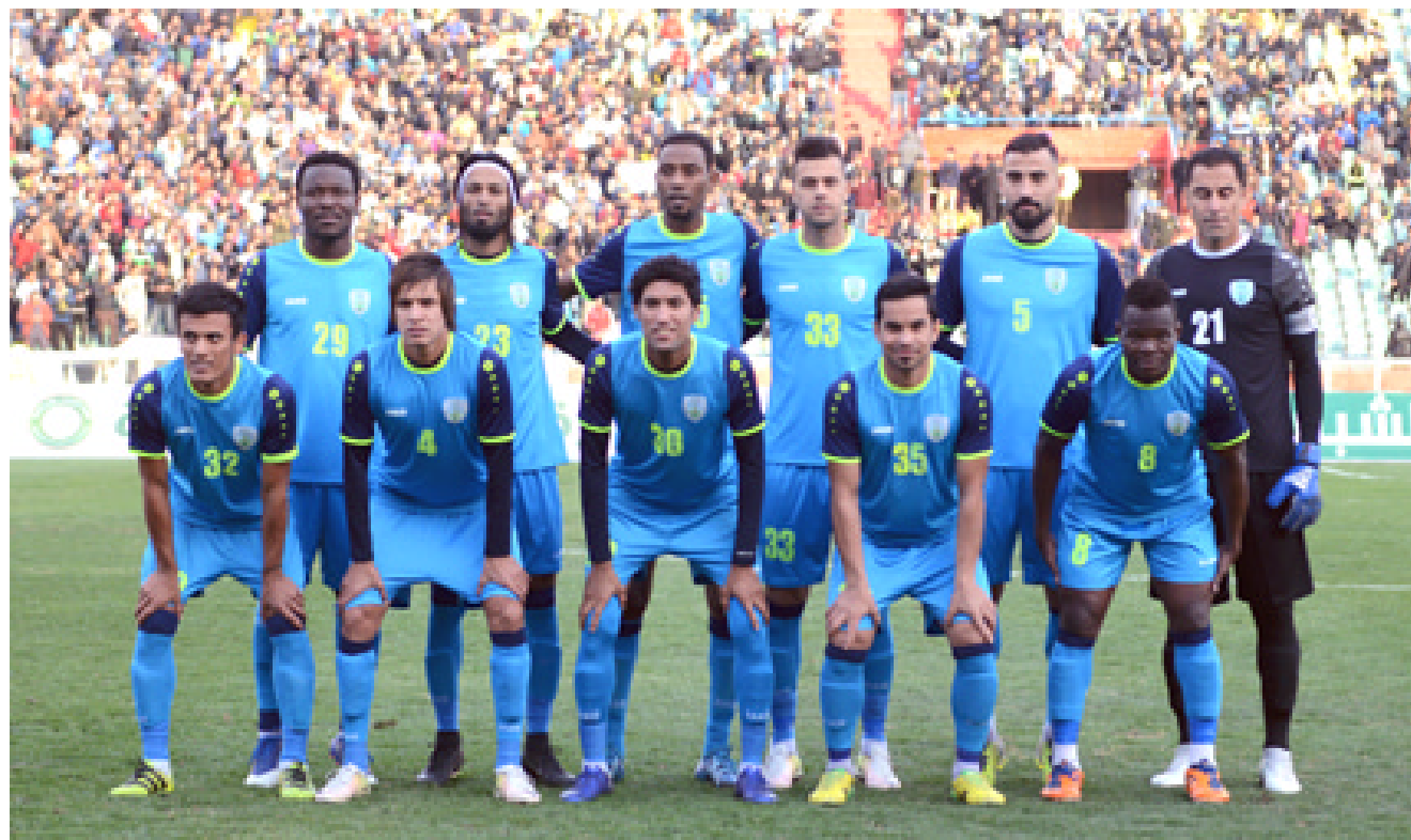
فوز: حقق فريق نطق الجنوب فوزاً مهماً على النجف في المباراة

يشهد تحسناً قبل أن تظهر الحاجة التي عمل جدي في قبل الادارة في ظل الموقف الصعب المهم تحديده بالقرص وقت لانه سيكون امام مهمة صعبة والمشهد الذي لا يحتاج الى تعليق بعد خسارة الجنوب التي عمق من جراحاته السلبية من جولة الاولى للفريق لن منذ بداية الدوري ونابو بقي النجف وقبيله الكهرياء والاعراب للفريق لن منذ بداية الدوري و74 ومرضى عمال 57 ونحو الفكار شاكر 91 في افضل نتيجته بعد خسارتين من الشرطة والامانة قبل ان يخرج بكل فوائد اللقاء وينتقل للتوقف التاسع بالفوز الثالث للفريق وعادل من الامور قبل ان تسير بالاتجاه المعاكس خصوصا عند مباريات الارض وتجرح خسارة الشرطة القليلة والعودة لعزف نغمة الفوز وتسجيل عدد الرب وفتهور الدور المطلوب من اللاعبين في جميع المناسبات فقط متمسكا في مبارياتين مطلوب من الفريق ان يلمح بقوة وان يظهر مهيمن من الاهداف في ظهور هجومي متسلطاً في مقر داره وهو المهم ان تسخر ميدان للتنازع الاجيابه امام صعوبه مباريات بالانهاب وتاريخها وشده وقعه امام ضياع النطق لن بقى الفوق في ملعبه وصلحت لن التخلي عنها سيعقد الامور التي تداركها الفريق في النهج التكتيكية التي عكس فيها مستواه الاوان والاستفادة من واقع النتائج الخبيدة والاعلان عن موجهة مع فريق الحسين بالبحرة وسيعتمد مستواه بعدما انخفض امام الشرطة والامانة قبل ان ينقل قوة بوجه النجف.