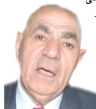
منيرة منه أنت بالعجب