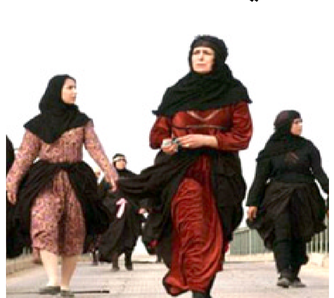
مشهد من فيلم (صمت الراعي)