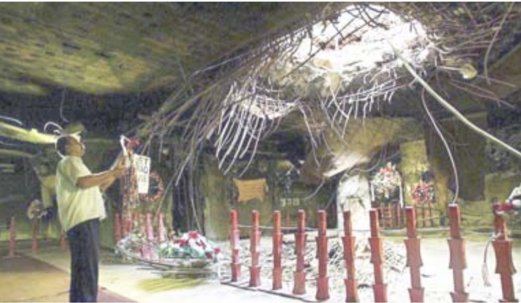
ملجأ: مواطن يقرأ سورة الفاتحة لأرواح عائلته الذين استشهدوا في ملجأ العامرية

قانون الأحوال الشخصية، وثمان ملفات مهمة ينتظر اصحابها التفاتة الحكومة لوضعهم. وقالت الناشطة نورهان شيراز امس (اننا ابنة شهداء ملجأ العامرية، وأطفلاً ورجلاً مسنن، راحوا ضحية حرب لا تحرم)، وأضافت (نحن نعيش في عراق