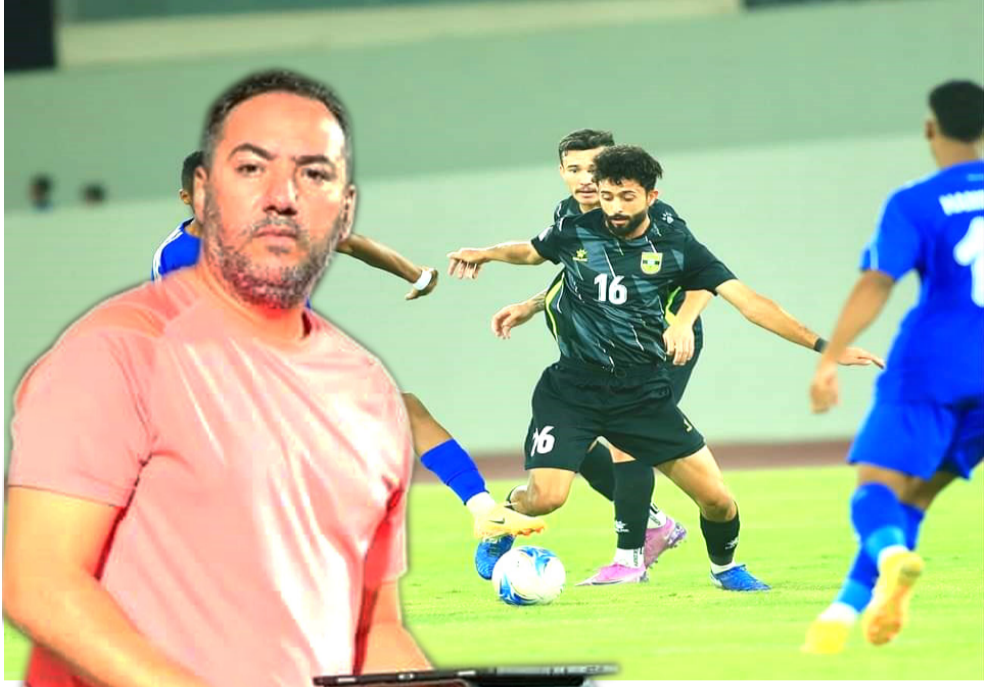
مواجهة، جانب من مواجهة فريق الكرخ مع فريق الميناء بالمئات

الظهور الفاعل بوجه أحد أطراف الصراع على لقب الموسم عبر تقديم المستوى الفني واللعب بروح الفوز وتقديم كرة جميلة ولان التعويل يبقى على تحويل مباريات الأرض لمصلحة ولاظهار انه فريق مختلف عن المشاركة الأخيرة وإنه في اتم الجاهزية لمباراة الضيف وإحباطه رغم ما يمتلك من أسماء.