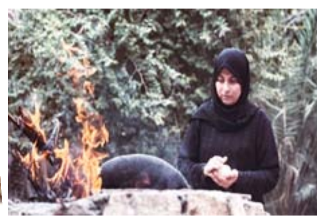
مسلسل :لقطات من مسلسل (الجنة والنار)