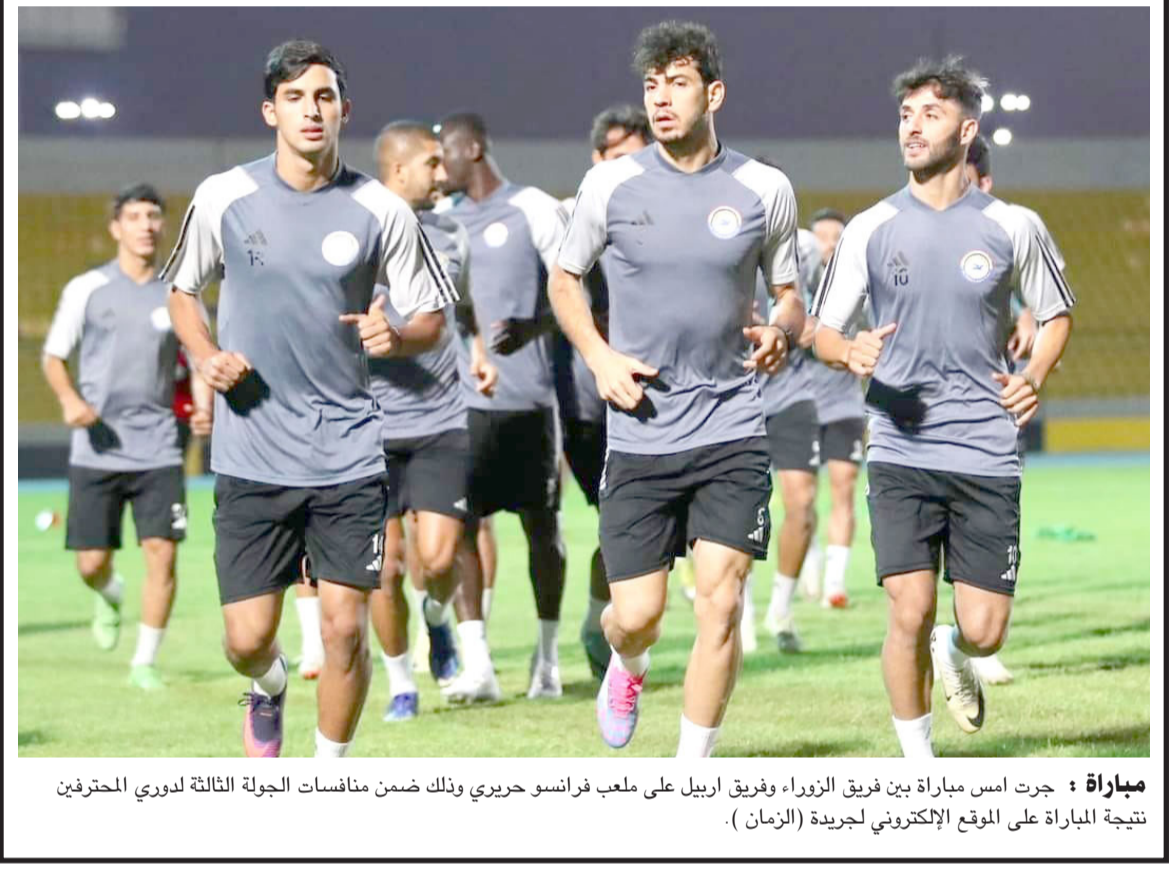
مباراة : جرت امس مباراة بين فريق الزوراء وفريق اربيل على ملعب فرانسو حريري وذلك ضمن منافسات الجولة الثالثة لدوري المحترفين نتيجة المباراة على الموقع الإلكتروني لجريدة (الزمان) .