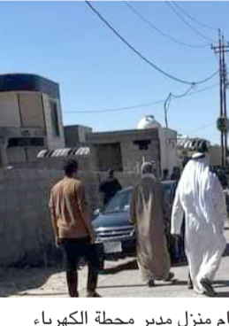
محطة : اهالي ناحية البغدادي امام منزل مدير محطة الكهرباء.

المحافظة بإتخاذ جملة من الإجراءات وتشكيل فريق عمل امني مختص لمعرفة ملاسات انفجار عبوة ناسفة، قرب احد المحال في منطقة المصلي. وقال بيان أمس إن (الانفجار أدى إلى إصابة صاحب المحل وزوجته ومواطنين اثنين، حيث تم نقلهم إلى مستشفى كركوك العام لإسعافهم). واصيب مدنيان بجروح اثر انفجار عبوة امام محل للمصرافة وسط المحافظة. وقال مصدر امني ثان إن (عبوة محلية الصنع كانت مزروعة امام محل للمصرافة في حي قصاب خانة وسط كركوك، أسفر انفجارها عن إصابة صاحب المحل وامرأة، وإحراق اضرار مادية في موقع الانفجار). مؤكداً إن (قوة امنية طوقت الموقع وأخلت المصابين إلى المستشفى للعلاج، وفتحت تحقيقات بالحادث). ونجحت مفاز المديرية العامة لشؤون المخدرات في وزارة الداخلية، في تفكيك 57 شحنة مخدرات دولية في بغداد والمحافظات.