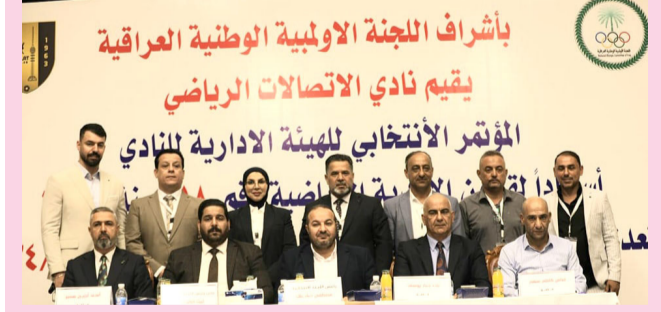
بإشراف اللجنة الاولمبية الوطنية العراقية يقدم نادي الإتصالات الرياضي المؤتمر الانتخابي للهيئة الادارية للنادي