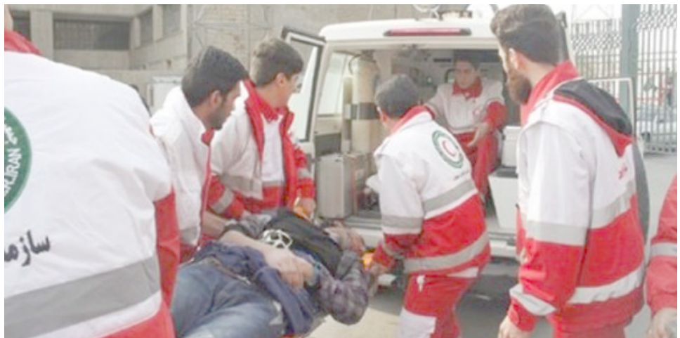
خدمات : فرق الهلال الاحمر تقدم الخدمات للزوار

(حدث الاصطدام الذي تعرضت له حافلة صغيرة تقل زوارا ايرانيين في الطريق من حلة الى كربلاء، ان الحادث ادى الى اصابة 13 زائراً ايرانياً)، و اضاف ان (اثنين من اصابين تعرضا لكسر في عظام القدم لذا فقد نقل الى ايران كما سيتم نقل الزوار الـ 11 الاخرين الى البلاد رغم ان اصاباتهم ليست