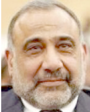
عادل عبد المهدي