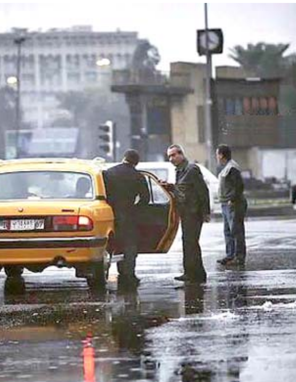
امطار: جانب من الامطار التي سقطت ليل اول امس على بغداد

وأضاف ان (درجات الحرارة العظمى ستسجل في بغداد 30 درجة مئوية والصغرى 17 درجة مئوية). وواضح البيان ان (الطقس سيكون في المنطقتين الشمالية والجنوبية غائما جزئيا مع فرصة لتساقط امطار خفيفة في اقسامها الشرقية ودرجات الحرارة مقاربة لليلوم السابق وستكون الرياح جنوبية شرقية خفيفة في معتدلة السرعة). وتابع ان (الامطار غزيرة ادت الى غرق تساقط امطار غزيرة ادت الى غرق بعض الشوارع الرئيسية وان