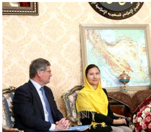
لقاء: ستانور ونايبة فرنسيين خلال لقائهم برئيس مجموعة الصداقة الإيرانية في طهران

ولفتت النائبة الفرنسية خصوصا إلى 'الآلية الخاصة' التي أعلنت عنها بركوسل في نهاية ايلول وهي عبارة عن نظام مقايضة يسمح لإيران بمواصله بيع النفط. وقالت 'هذه الآوات ليست مثالية، ونحن نعرف ذلك. من جهةه مثل جلاي نعتقد ان إجراءات الاتحاد الأوروبي والأوروبيين يجب ان تذهب أبعد من ذلك، شاكرا البرلمانين الفرنسيين. وأضاف أمل ان يتم الوفاء بالوعود التي قطعت، وأن ما أعلنه الاتحاد الأوروبي سوف يتم تنفيذ قبل الرابع من تشرين الثاني/نوفمبر. لكن بونكاراي أكد أنه من غير الممكن وضع الآلية الخاصة موضع التنفيذ قبل 4 تشرين الثاني/نوفمبر، معرباً عن امله في التمكن من ذلك في الربع الأول من العام المقبل.