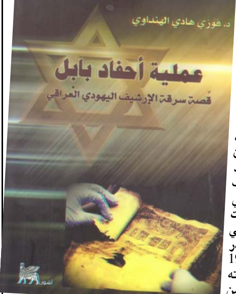
أهمية الإرسيف اليهودي العراقي