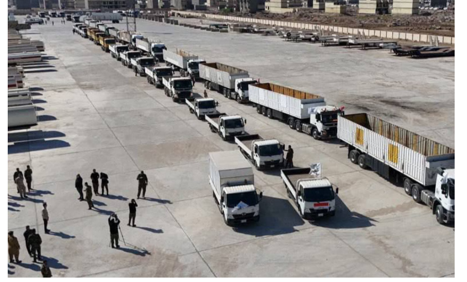
قافلة أسطول من الشاحنات ضمن قافلة مساعدات عراقية متواصلة إلى لبنان