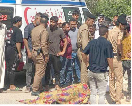
جثمان المحامي محاطا بأفراد الشرطة بعد سقوط جثمانه أرضا

الداخلية تنفي شائعات ترؤج لهجوم السبيرياني