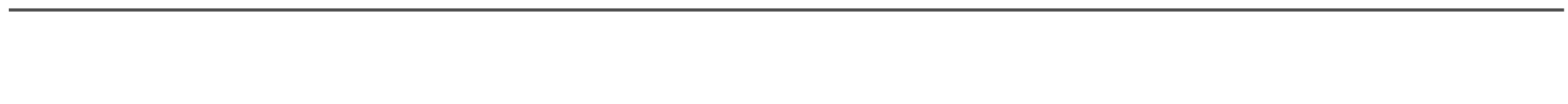
البالغ لكن اهم شيء هو انني طلّبت عمود عن الدخان عن شكل فطر يمكن رؤيته على بعد كيلومترات في هذه

ادانت رابطة المرأة العراقية الانتهاكات وأشكال العنف التي تستهدف النساء العراقيات. وطرح في بيان تلقته (الزمان) أمس ست توصيات تمثلت في (تحسين الحقائق والكشف عن الجناة ومفذي الجرائم ضد المرأة ومن يفك وراءهم وتقديمهم إلى العدالة ومحاکمتهم ليثابروا جزاءهم العادل. واتخاذ إجراءات رادعة لإيقاف جرائم التصفية والإغتيالات التي تطال النشاط والنساء خصوصاً والكشف عن فئات التحقيق وإعلانها لراي العام. وحملة إجراءات سريعة وعاجلة لحماية النساء والمدافعين والمدافعات عن حقوق الإنسان. وطالبان بان تكون هناك شفافية في اعداد التقارير الخاصة بالانتهاكات والعنف اللذين يتعرض لهما النساء من قبل المفوضية العليا المستقلة لحقوق الإنسان توفير الاجراء الامنية