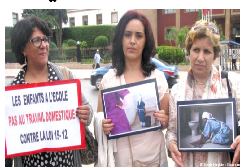
بقية الخبر على موقع (الزمان)

الاستفناء بـ (الانتهاك الصارخ لمصلحة الطفل الفضلي). واعتبر الانتحار في بيان أن هذا القانون سينظم ظروف عمل هذه الفئة (على الرغم من عيوبه والصعوبات المتوقعة في تنفيذ العديد من أحكامه). داعياً إلى (ضرورة تحسينه). ولا تتوافق أرقام رسمية حول عدد الخادمت في المغرب. لكن دراسة أجرتها جمعيات في عام 2010 أظهرت أن عدد العاملات المغربية. وسجلت اسبانيا في الخدمة المنزلية اللواتي يقل عمرهن عن 15 عاماً، يراوح بين 66 ألفاً وثمانين ألفاً، وغالباً ما يأتين من الأرياف ويحرمن من الدراسة. وقالت المدافعة عن حقوق المهاجرين إيلينا مانيو على حسابها في موقع تويتر إن