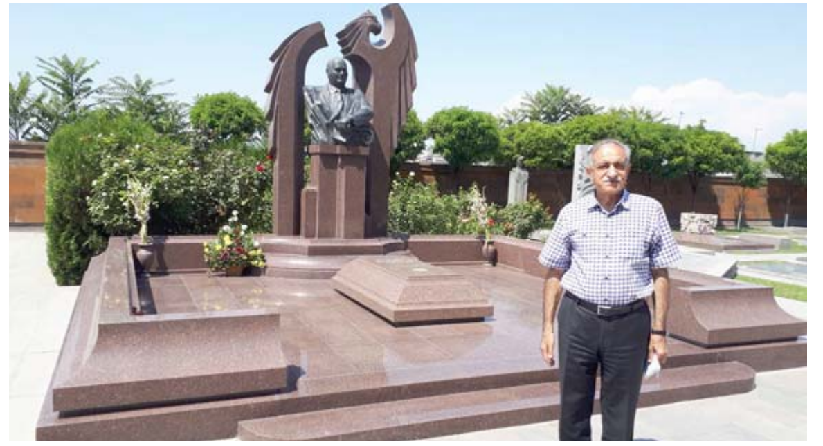
ضريح رئيس الوزراء السابق اندرايك ماركرينان في مقبرة المشاهير