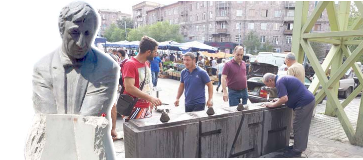
نافورات مياه الشرب موزعة للسابلة في شارع كوميتاس