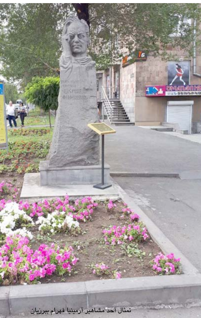
تمثال أحد مشاهير أرمينيا فهرام ببرزيان

مكلتيسان وارام خاجاتوران وشاعرة ارمينيا سلفا نابوتكيان وكوميتاس (1869- 1935) الذي اطلق اسمه على واحد من اهم شوارع العاصمة، وراج مزيجيان فضلاً عن الرئيس الارمني السابق ديمرجان. وتتوزع قبور منظر مؤلف من نحو 25 شخصية على فضاء مفتوح يوحي بان ارواحهم حاضرة، وان لا مكان يحجب عنها رؤية ارمينيا وهي تنمو وتكبر وتتفاعل في بيئة دولية تحظى من خلالها بالاهتمام واتساع التعليم وخدمات الصحة والبلدية والتعليم، ومن جميل ما رايت في المكان بعض الاشجار