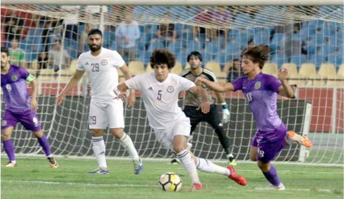
التعادل يفرح نفسه على لقاء الزوراء والشرطة.. عسة (الزمان) قطان سليم

جانبه بدات تظهر مخاوف جمهور الشرطة بسبب نزف النقاط التي قد تترك تأثيرها على مسار الامور وتاخر الفريق الذي يضم مجموعة لاعبين تلعب سوية مع عدة مواسم قبل ان يضاف اليها عدد اخر ولو التعادل مع الزوراء يعد مقبولا لانه الاخر حضر كثيرا ودعم خطوطه باسماء معروفة ولو انها الأخرى اخفت وغاب الحضير الذهني ولم تظهر محاولة مهاجمة في التسجيل لتدقيق الشباك نظيفة امام غياب خبرة لاعبي المنتخب الوطني في التأثير على سير الامور وفرصة الخروج بكامل العلامات، والشرطة سيكون امام اختيار صعب لمواجهة النفط الذي لآزل يشكل عقدة امامه وقادر على إسقاطه تحت انظار جمهوره في الوقت الذي يخرج البطل الى ملعب