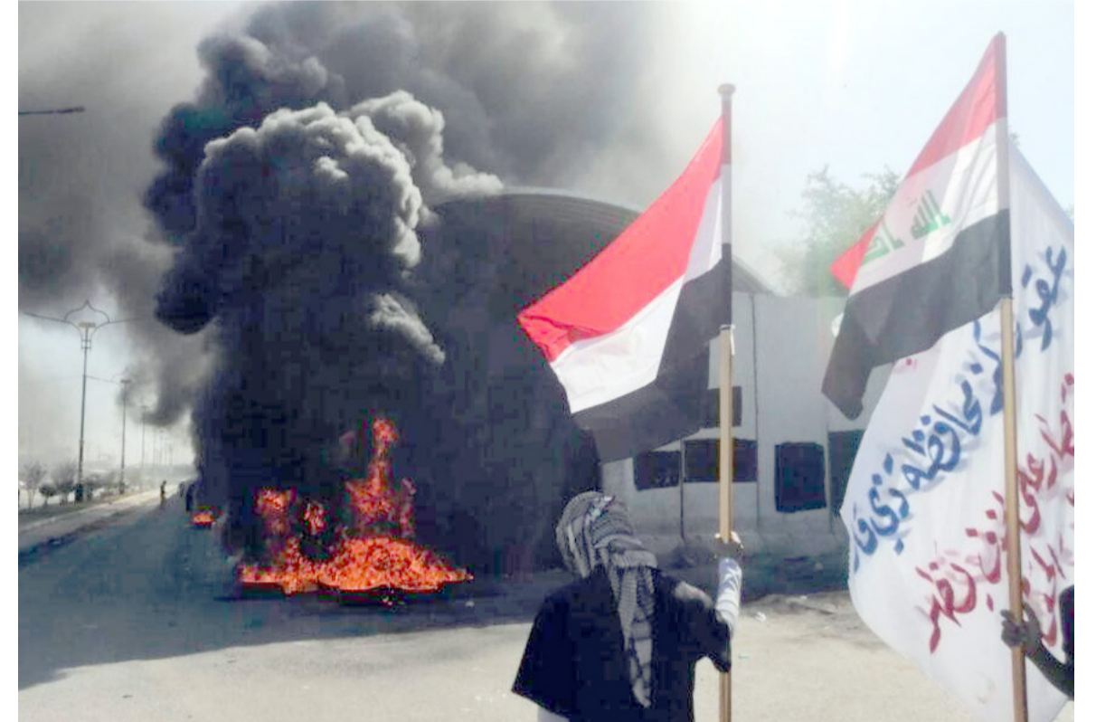
احتجاج : متظاهر في ذي قار يحتج باشعال الاطارات امام مبنى المحافظة

من تسعة آلاف درجة. وقال شهود عيان أمس إن (قوات مكافحة الشعب تدخلت من أجل إبعاد المتظاهرين وفتح المبنى، الأمر الذي تسبب في حدوث احتكاكات بين الطرفين). فيما أكد قائد شرطة المحافظة، أن سلامة المتظاهرين السلميين