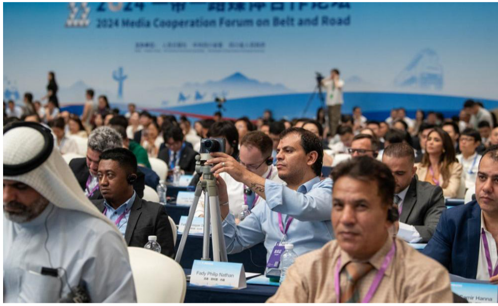
منتدى: جانب من فعاليات منتدى التعاون الإقليمي بمشاركة دولية

الثقافية مثل النصوص البوذية والموسيقى الهندية). كما تطورت طرق الحرير مع الزمن، وشكلت التجارة البحرية أهمية بالغة في شبكة التجارة العالمية، واشتهرت بنقل التوابل، حتى عرفت بطرق السقوابل، حيث زودت أسواق العالم بالقرقة والبهار والزنجبيل والقرنفل وجوز الطيب.